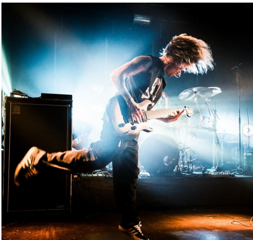
Koncert britského nu-metalového tria Profiler ve Futurum Music Bar. 61

Koncerty se mohou výrazně lišit v dynamice a energii, přičemž klíčové prvky se často zaměřují na výkon interpretů, jejich schopnost předvést hudbu, předat energii a komunikovat s publikem. Vystoupení britského nu-metalového tria Profiler představuje úspěšný příklad, jak lze tyto prvky harmonizovat. Kapela Profiler demonstrovala vynikající schopnost komunikace s publikem. Fanoušci je od první skladby nadšeně povzbuzovali, což vedlo k intenzivním moshpitům, kde se emoce projevovaly natolik, že se ztrácely hodinky a boty. Během koncertu bylo také možné zaznamenat několik stage-dive akcí, kdy fanoušci skákali z pódia do davu. Synchronizované headbangování zpěváka, kytaristy a baskytaristy dodalo vystoupení další úroveň energie. Kapela často mezi skladbami děkovala fanouškům, povzbuzovala je a pomáhala udržet kontrolu nad moshpity. 60