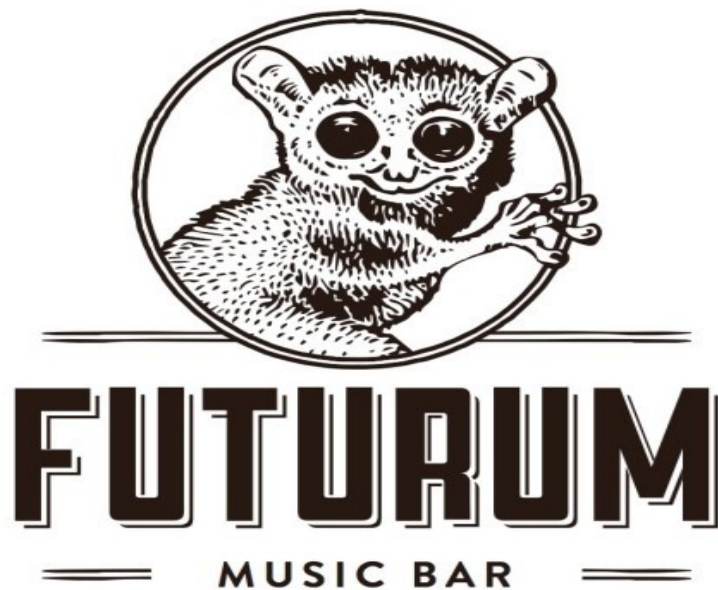
Logo Futura. Zdroj: (Futurum Music Bar, 2024). 11