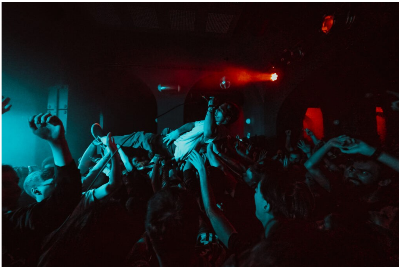
Koncert Dead Poet Society. 22

dorazili co nejdříve, aby si zajistili dobré místo, přestože Futurum je poměrně malý klub s kapacitou 400 osob. To znamená, že fanoušci, kteří chtějí být co nejbližší interpretovi během koncertu, se bez problémů dostanou do předních pozic a není tedy nutné se ukázat velmi brzo před začátkem akce.