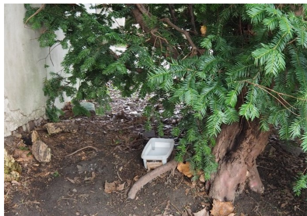
Nenápadné stopy krmících míst