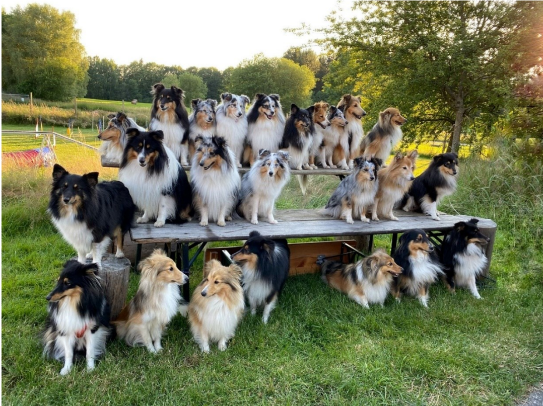
Obr. č. 2 Šeltie v hojném zastoupení (nejvíce zastoupené plemeno z celého tábora).