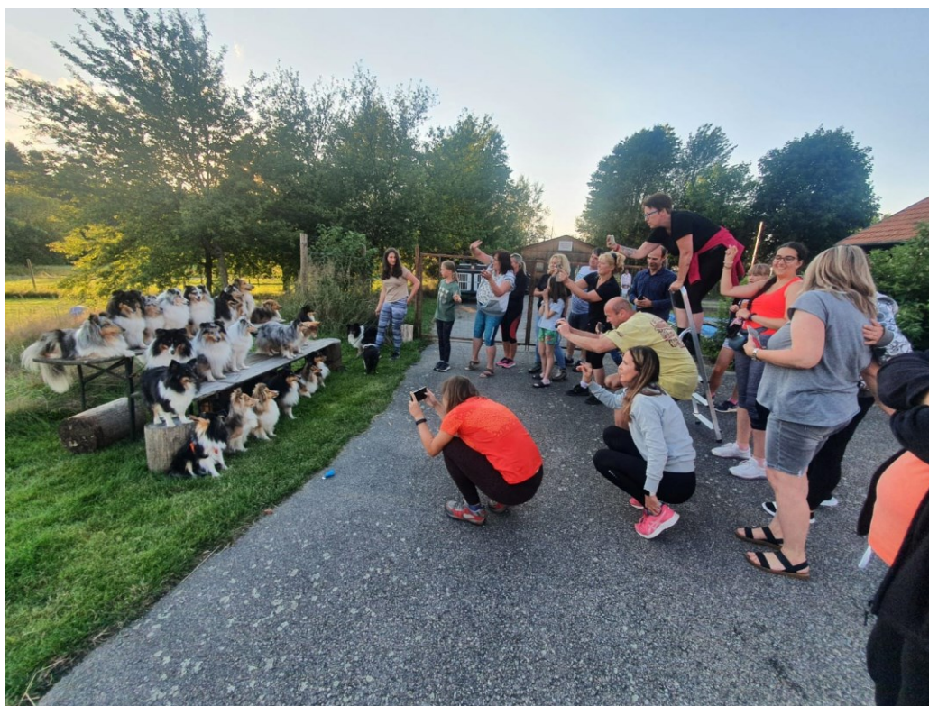
Obr. č.1 – aktéři a jejich psi při snaze zachytit snímek, kde budou přítomni všichni zástupci plemene sheltie psiho tábora v Celnici pohromadě.