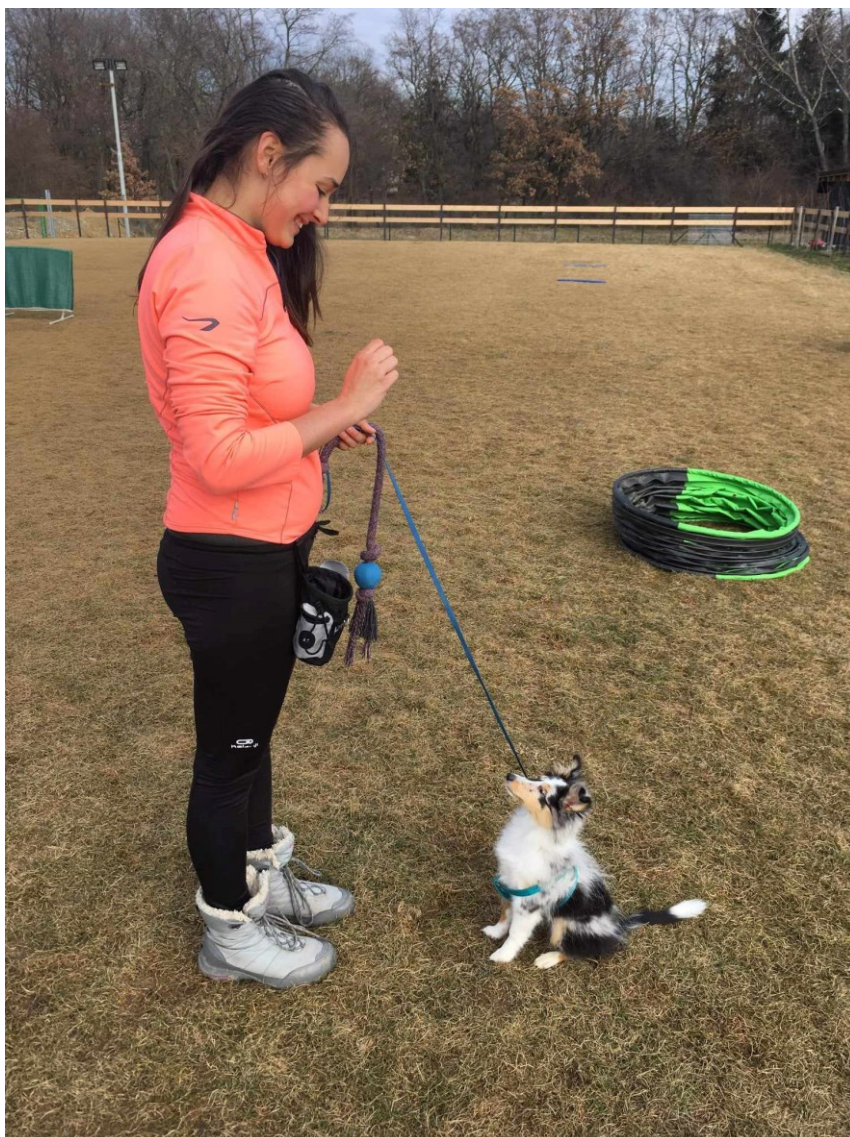
Obr.č. 8 První vstup do kynologického pole