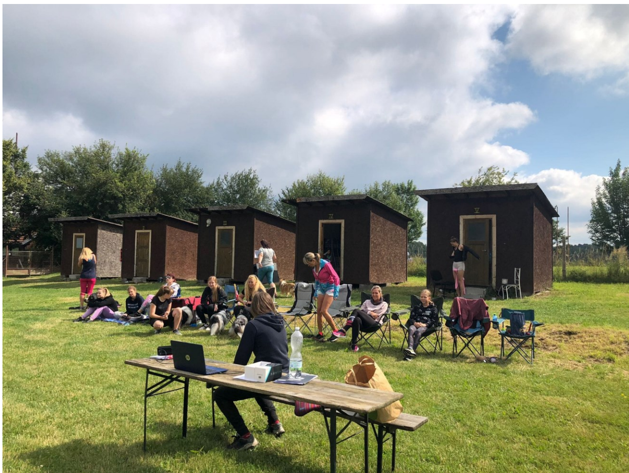
Obr. č. 5 Dogdancingové zkoušky odehrávající se na place – rozhodčí DD a obecenstvo (přední region)