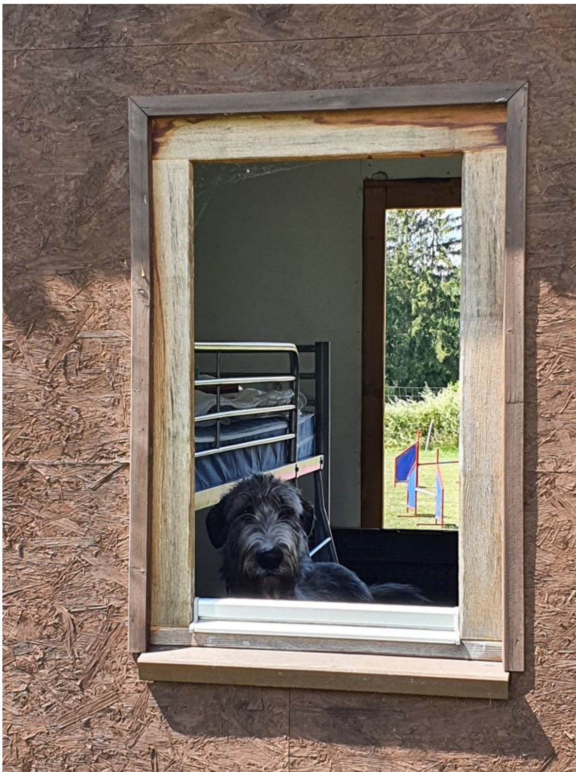
Obr. č. 6 Největší a nejvyšší tanečník z celého tábora vyčkávající v chatě – Irský vlkodav