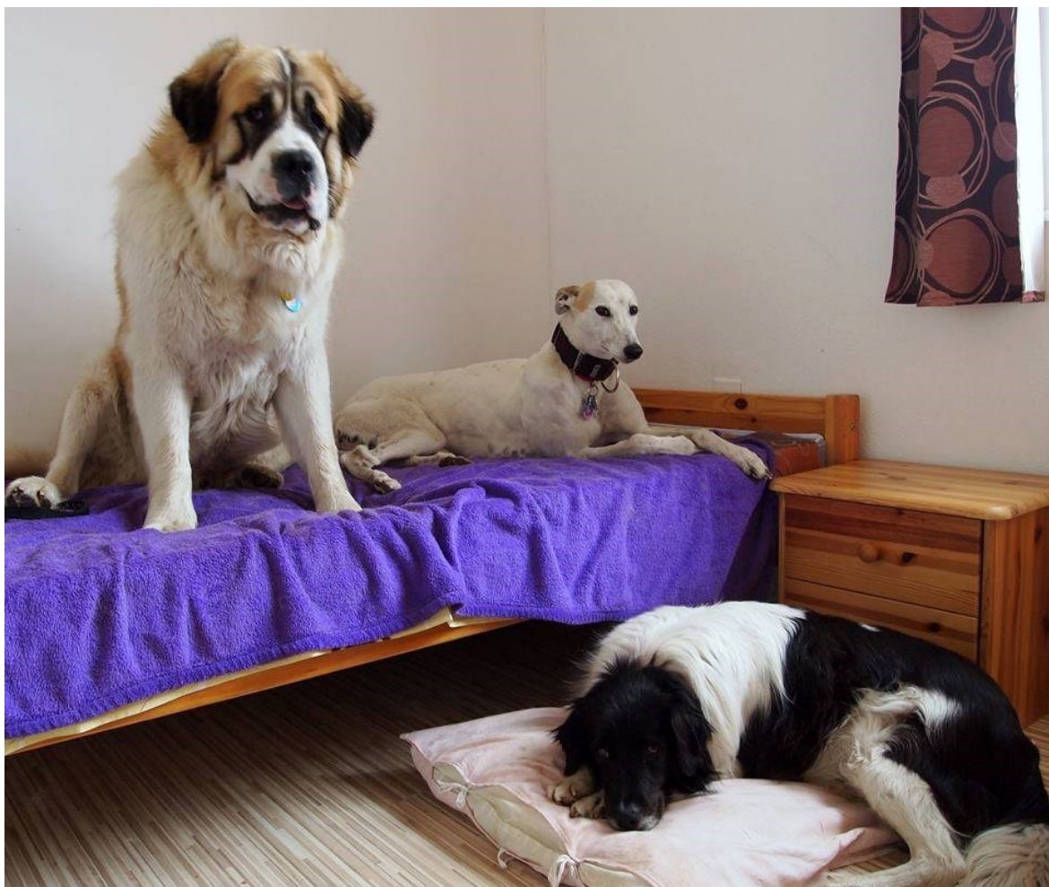
Obr. č. 3 Fotografie z webu penzionu Na Celnici https://www.penzionnacelnici.cz/moznosti-ubytovani/ , který oficiálně zveřejňuje a propaguje dog-friendly ubytovací prostor