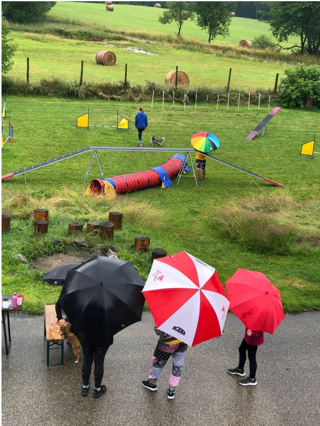
Obr. č. 4 Ani déšť nezastavil kynologické aktivity.