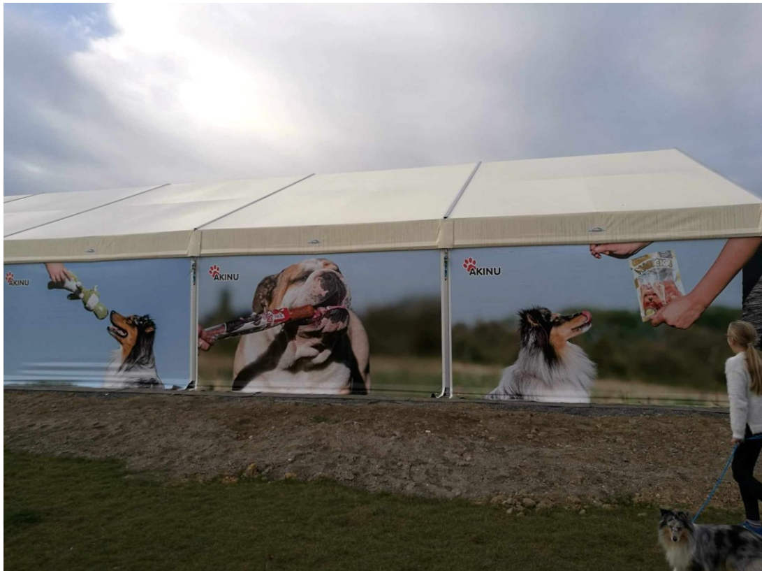
Obr.č.9 Prostory PESOPARKU. Stan, obrandovaný sponzorskou značkou AKINU, uvnitř kterého probíhají lekce dogdancingu