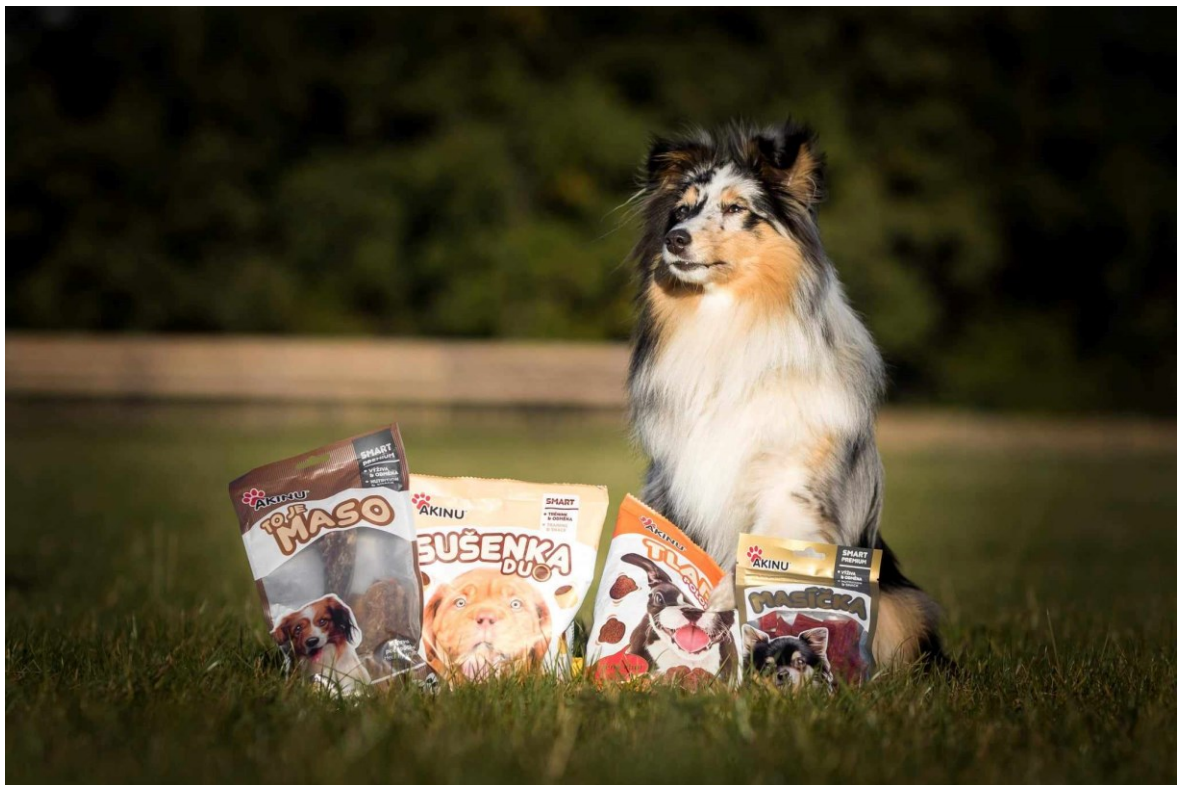
Obr. č. 10 Síla sociálního kapitálu v praxi (Pší model Ikebara Van Bery promující pamlsky pro značku psích krmiv AKINU