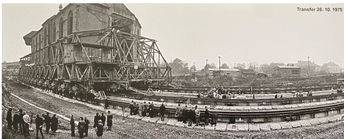
Obrázek 18.: Mostečané sledují přesun děkanského kostela z historického jádra. 127

založeného Přemyslem Otakarem II. a výstavbu města nového. Snad, jednou...“. 125 Největším zachovaným kulturním odkazem na staré město je děkanský kostel Nanebevzetí Panny Marie, který byl pečlivě naložen na koleje a přemístěn z historického jádra. Jednalo se o zcela ojedinělý proces, kdy byla budova o hmotnosti 12 tisíc tun přesunuta na vzdálenost 841,1 metrů, přičemž transport trval necelý měsíc. 126 Toto gesto vyjadřuje důležitost sakrální stavby i technickou vyspělost Československa v období státního socialismu a lze ho interpretovat různě. Faktem ale je, že dodnes se jedná o zcela jedinečnou realizaci, která ve světě nemá obdoby a vhodně ilustruje „neomezené“ možnosti minulého státního režimu.