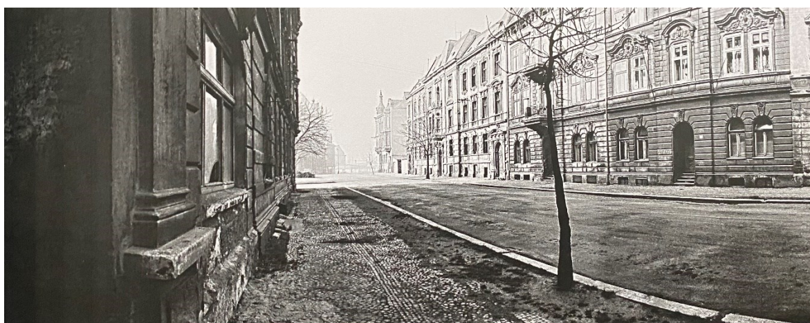
Obrázek 2.: široká ulice Svatopluka Čecha ve starém Mostě. 17

podnikatelů umístěné v centru a na úpatí hněvinského vrchu, kde vyrůstá nová vilová čtvrť Zahražany. Vedle národnostních a etnických sporů se zde začala vyostřovat třídní dichotomie vykořisťovaných dělníků a horníků z chudých dělnických kolonií a zbohatlých buržoazních měšťanů žijících v centru města. Od osmdesátých let se v dělnických koloniích začaly formovat různé dělnické a hornické politické spolky a roku 1882 propukla první generální stávka za zlepšení pracovních podmínek, která byla násilně potlačena. V následujících desetiletích dělnické socialistické hnutí zorganizovalo několik dalších protestů a stávek proti uhelným mocnostem a tento politický boj severočeských horníků proti kapitalistickému vykořisťování byl obzvláště často připomínán po druhé světové válce po nástupu komunistické strany k moci. 16