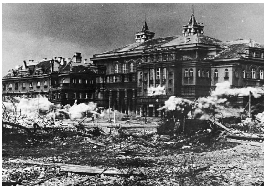
Obrázek 10.: Demolice Hornického reprezentačního domu. 68