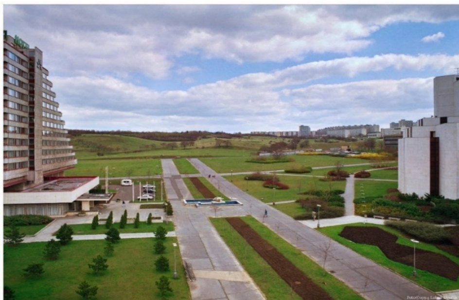
Obrázek 21.: Mostecké centrum stále čeká na své dokončení. 131

Výstavba městského centra se značně prodloužila, hlavní objekty byly dokončeny s velkým zpožděním, některé se vůbec nerealizovaly a v centru zůstaly pouze holé travnaté plochy. Po sametové revoluci došlo k zahuštění některých ploch a původní návrh doplnila například budova finančního úřadu, která však svou formou a estetikou příliš nezapadá do celkové koncepce. Velikým zásahem do původního návrhu bylo vybudování rozsáhlého obchodního centra Central Most, které využilo volné plochy na Prvním náměstí, které po dlouhou dobu bylo nedokončené a jehož velkou část tvořilo pouze parkoviště. Obchodní centrum zásadně narušilo zamýšlený návrh a vytvořilo vysokou stěnu, která náměstí z jeho západní strany zcela uzavřela. Umístění předimenzovaného moderního obchodního centra mezi výstavní reprezentativní budovy z období státního socialismu nabízí jedinečný kontrast a vystihuje současný postoj a mínění vůči stavbám minulého režimu i moc peněz. Detailně promyšlený návrh městského centra tedy nedosáhl své zamýšlené podoby a při změně politického režimu se změnili i podmínky pro další vývoj. Centrum nového Mostu však stále čeká na své dokončení a bude zajímavé sledovat, kudy se jeho osud bude ubírat.