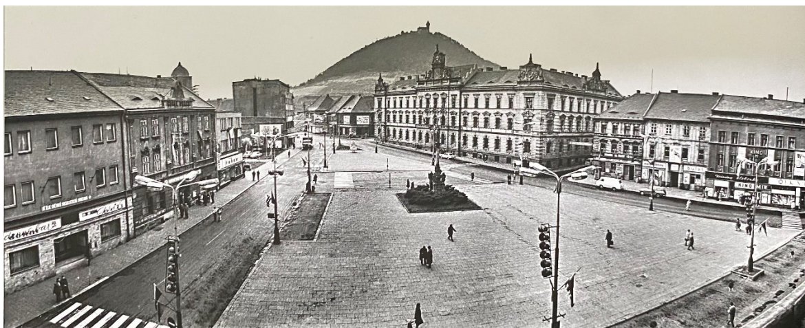
Obrázek 1.: Pohled na I. náměstí z roku 1972. Vzadu reprezentativní budova soudu. 11