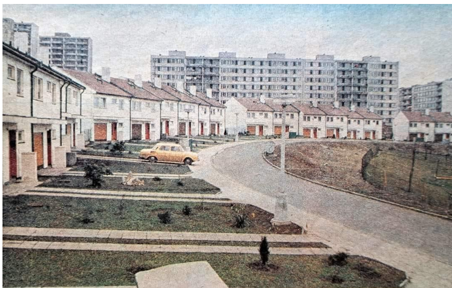
Obrázek 14.: Neobvyklá řadová zástavba rodinných domů Okály . 112

konstrukční soustavy různých typů a dispozic. Najdeme zde nejstarší soustavy řady T, tvořené ještě z cihel, ale doplněné o typizované prvky betonových stropů, schodišť apod. Tato soustava byla uplatněna v nejstarších sídlištích Stalingradská a Podžatecká. Klasickým panelovým domem nového Mostu je konstrukční soustava G 57, která je v tomto případě mírně upravena. Nejčastěji je v Mostě zastoupena soustava T08B, která je zde provedena i v modernizovaném označení T08B-78. Kromě klasických deskových panelových domů se v Mostě uplatnily i věžové domy soustavy T06BU, které lemují hlavní městskou třídu Budovatelů. Problematika prefabrikovaných konstrukčních soustav je velmi obsáhlá a proto zde uvádím pouze vybrané příklady. V některých mosteckých sídlištích se uskutečnily zajímavé experimenty, jako například v městském obvodu 6 přezdívaném „pětistovky“, kde se uprostřed panelového sídliště vysokých domů vystavěla skupina dvoupodlažních řadových domků s malou zahrádkou přezdívaná Okály , ve které lze sledovat vliv anglických zahradních měst. Velkým nedostatkem panelových sídlišť budovaných v období státního socialismu byl zejména omezený výběr konstrukčních soustav a sídliště působila monotónně.