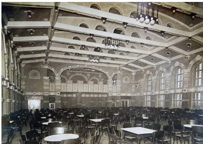
Obrázek 9.: Interiér velkého sálu v Hornickém reprezentačním domě. 67

dvě další velká sídliště Stalingradská a Podžatecká. Doposud se město spíše nesystematicky rozšiřovalo o nové převážně dělnické čtvrti a již v padesátých letech se začalo o Mostě uvažovat jako o klíčovém podkrušnohorském centru. Začala se rodit vize nového Mostu jako moderního racionálně uspořádaného okresního města, rozděleného podle funkcí do zón a s reprezentativním městským centrem. Utopická vize, která byla doposud pouhou možností, nikoliv však rozhodnutím, se na počátku šedesátých let měla stát realitou.