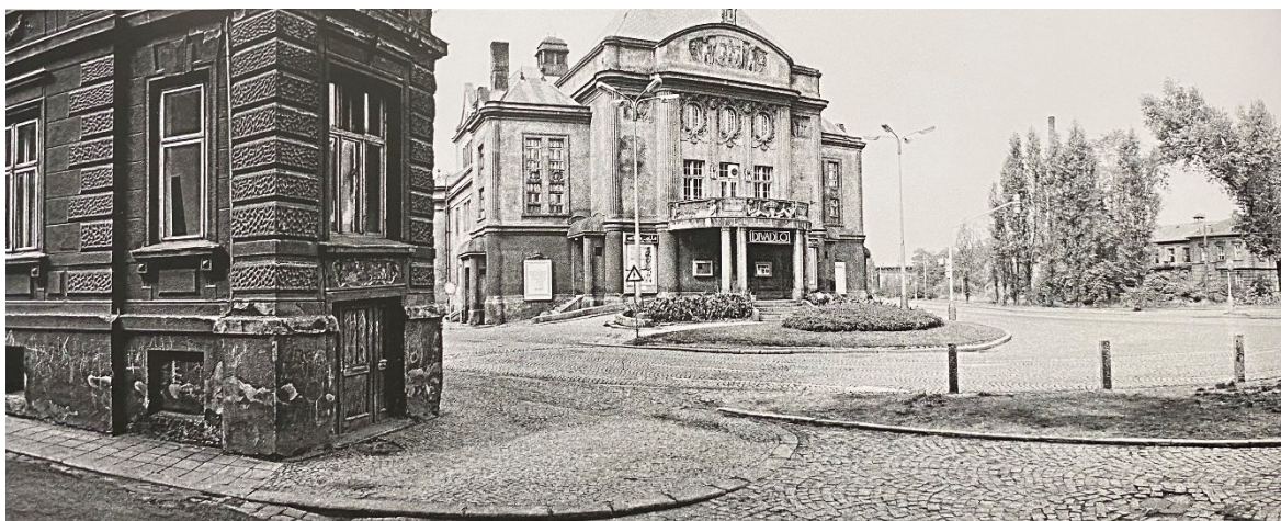
Obrázek 5.: Pohled na městské divadlo na Smetanově náměstí. 30

Spojíme-li si tyto skutečnosti dohromady, tedy na jedné straně pocit odcizenosti nově příchozích obyvatel vůči průmyslovému, špinavému a historicky z velké části německému regionu, k tomu se přidá nouze a bída poválečné Evropy, která potřebuje neustálé přísuny paliva pro svou obnovu, a klade se tedy stále větší důraz na těžký průmysl a těžbu nerostných surovin. K tomu ještě v kontextu starého Mostu výskyt rozsáhlých uhelných ložisek pod městem, noví socialističtí vládcí, kteří postupně cílejí na dosažení surovinové soběstačnosti a hospodářský systém přeorientovávají na těžký průmysl s efektivní produkcí, a v neposlední řadě stále sílící vliv obrovské těžbařské společnosti, spravující těžbu v celém severočeském uhelném regionu. Kombinací všech těchto historických okolností získáváme vhled do dynamického období poválečného strádání a hledání nových jistot a východisek. V případě Mostu bylo jedno jisté – vzhledem k rostoucí poptávce po hnědém uhlí a jeho nezbytnosti k zajištění blahobytu i technologického pokroku je třeba udělat vše pro jeho získání. I kdyby to mělo stát zánik krajiny, celých obcí i měst.