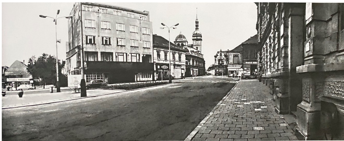
Obrázek 3.: Funkcionalistická budova České záložny na I. náměstí. Vzadu přesunutý kostel Nanebevzetí Panny Marie. 24