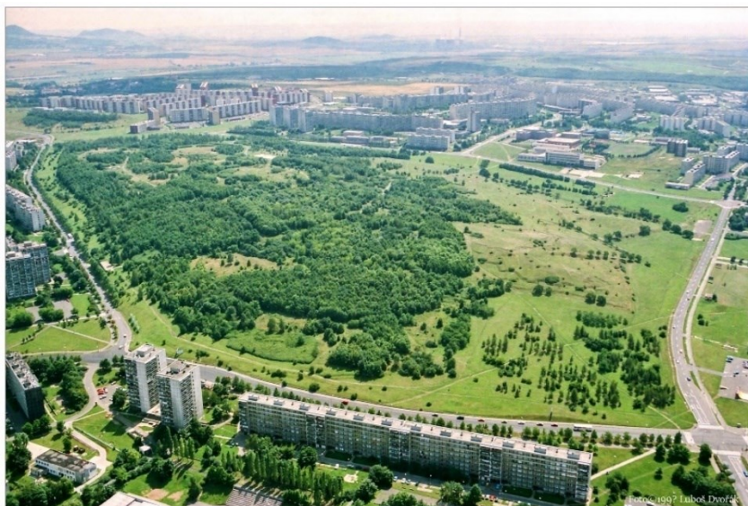
Obrázek 17.: Letecký pohled na centrální park Šibeník. 120

dostatek parků, sportovních zařízení, stadionů, koupališť atd. 118 V návrhu nového Mostu se počítalo hned s několika městskými parky, přičemž ten největší městský park Šibeník je umístěn v jádru města a svým rozsahem a podílem zeleně připomíná lesopark. Podle Krejčího je tento park základním organizačním prvkem a podstatnou částí architektonické kompozice města, která má zlepšovat přírodní i životní prostředí a vytvářet charakteristický a kontrastní obraz města. 119 Rekreaci zajišťuje i rekultivovaný lom Benedikt v jihovýchodní části města.