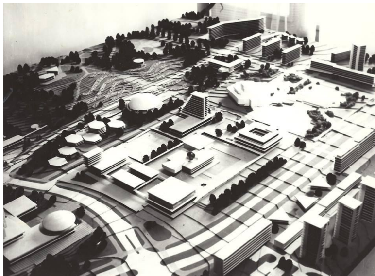
Obrázek 11.: Model nového městského centra. 88