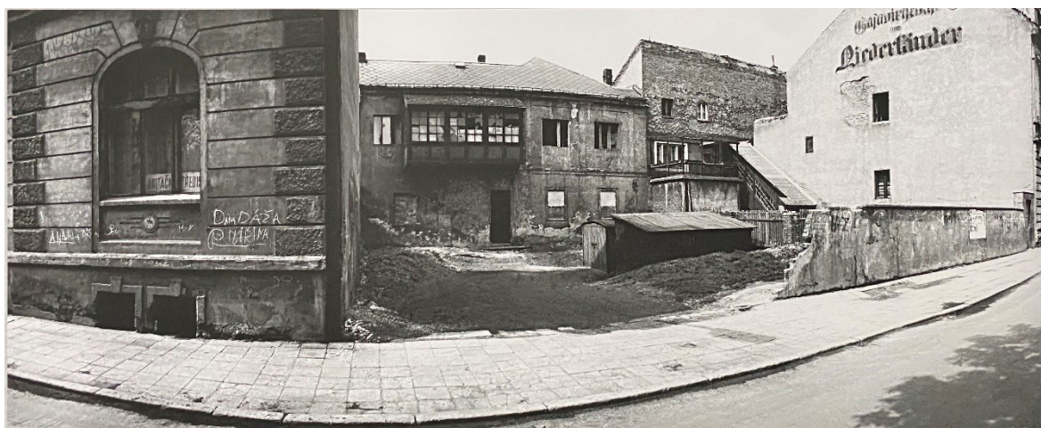
Obrázek 4.: Rozmanitá zástavba ve starém Mostě. Vpravo na štítu domu stále německé nápisy. 28

zpravidla neměly koupelnu. “ K otázce kondice samotných budov a příslušné infrastruktury dodává: „300 z 1300 domů bylo v havarijním stavu, a aby se v nich dalo dále bydlet, vyžadovaly okamžitou opravu střech, zajištění statiky, rekonstrukci vodovodu či kanalizace.“ 25 Obraz města v této době tvořily děravé ulice lemované zašlými měšťanskými domy se zašedlou oprýskanou omítkou a rozbitými okny, jejichž stav v důsledku absence investic do jejich oprav budil obavy ze sesuvu. V důsledku neochoty investovat do modernizace města a technické infrastruktury tvořilo staré město 88,5 % objektů postavených za Rakouska-Uherska a bez hygienického vybavení. 26 Německou historii havířského města připomínaly původní německé nápisy a cedule na fasádách některých domů. Na denním pořádku byly inverze a husté smogové mlhy z blízkých průmyslových závodů, přes které nebylo možné dohlédnout na konec ulice. Kvůli zvýšenému výskytu popílku a prachu bylo celé město obaleno tenkou černou vrstvou a v zimě se čistě bílý sníh po dopadu proměňoval do černa. Koho by snad napadlo jít se umýt do říčky Běly protékající městem, musel by být blázen – po uvedení chemických závodů v Záluží do provozu se prý změníla na silně pěnící červeno-fialovou kapalinu, která podle dobových vyprávění mohla po přidání siřičitanu a mírné úpravě pH sloužit jako fotografická vývojka. 27