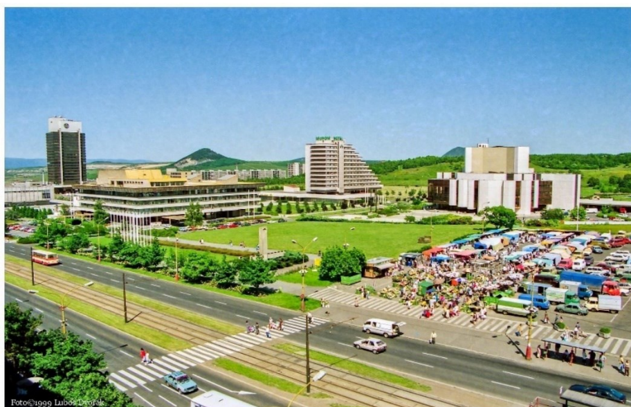
Obrázek 20.: Snímek nového městského centra z devadesátých let. 130