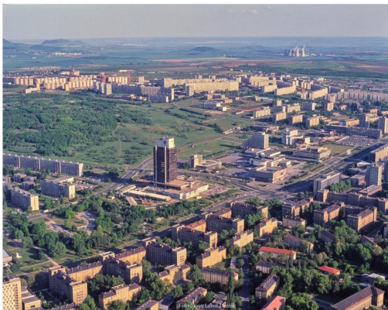
Obrázek 13.: Pohled na rozmanitou městskou zástavbu nového města. 110

reflektovaly špatné hygienické podmínky průmyslových čtvrtí a nabízely různé alternativy v podobě zahradních měst s dostatkem zeleně apod. Stejně tak architekti CIAM již ve třicátých letech prosazovali průmyslovou typizovanou výstavbu ze stavebních dílů, které učiní výstavbu efektivnější a ekonomičtější. Zavržením blokové zástavby a koridorové ulice zároveň zavedli nový systém zastavovací soustavy paralelně řazených domů stejné orientace ke světovým stranám, čímž se docílilo vhodného oslunění a provětrávání pro všechny byty stejně. Současně byl tento „systém prší“, jak ho Hrůza a další architekti nazývali, vhodný i pro efektivní montáž staveb pomocí jeřábových drah. 109