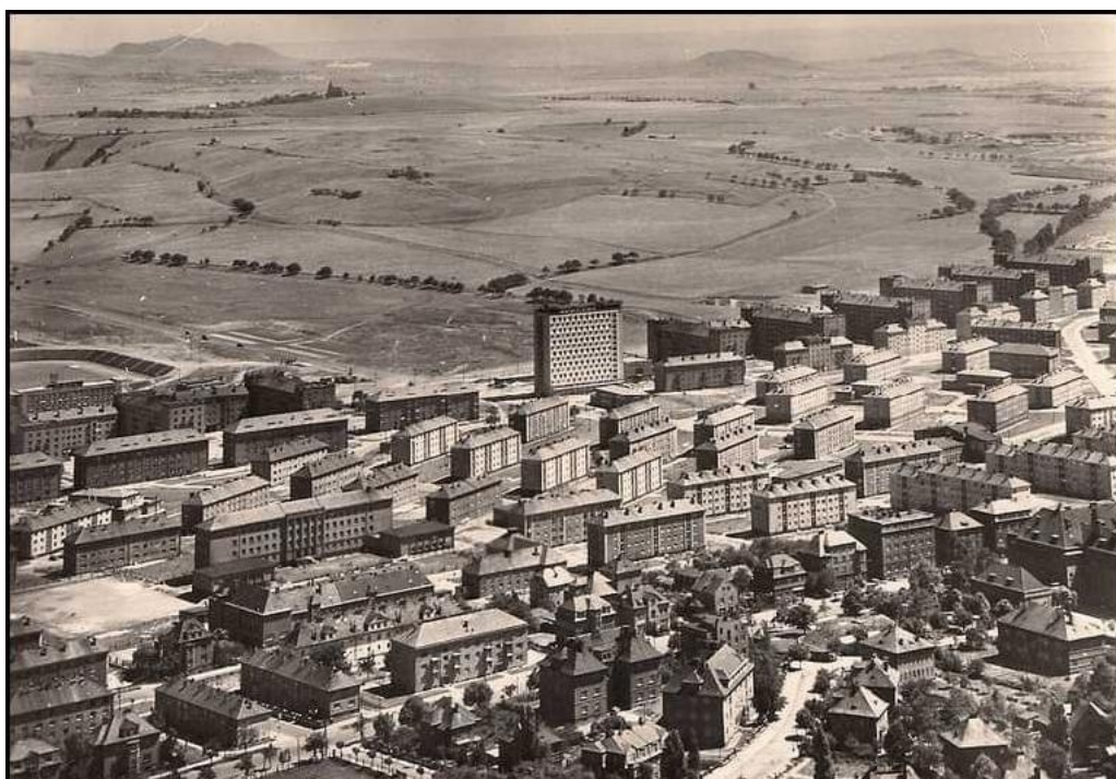
Obrázek 7.: Sídliště Podžatecká s rozvolněnou racionální zástavbou bytových domů. 55

Koncem padesátých let dochází k dalším závažným změnám. V architektuře a urbanismu doznívá socialistický realismus a přichází nová vlna architektů, kteří chtějí tvořit svobodně bez diktátu strany. V bytové výstavbě postupně mizí převládající historizující zaměření architektury a urbanismu a přednost dostává ekonomické stavění „na nejnižší možné úrovni přijatelnosti“. 54 Důležitým mezníkem a předzvěstí pro novou éru byl úspěch Československa na Světové výstavě Expo 58 konané v Bruselu roku 1958, kde tým československých architektů a umělců sklídl obrovský úspěch za vystavené exponáty a zejména za moderní a elegantní výstavní pavilon od trojice architektů F. Cubra, J. Hrubého a Z. Pokorného. Tento celosvětový úspěch ukázal, že je čas ke změně a že se československé umění a architektura mohou vrátit k modernímu výrazu. Národní hospodářství nicméně nadále následuje vytyčené pětileté plány a sílí důraz na těžký průmysl a energetiku. Starý Most se pozvolna rozrůstá směrem na jih, historické centrum chátrá a jeho obyvatelům se debaty o jeho demolici zdají čím dál tím více reálné. Začínají se pořádat jednání ohledně budoucnosti historického města a již brzy bude rozhodnuto o jeho osudu.