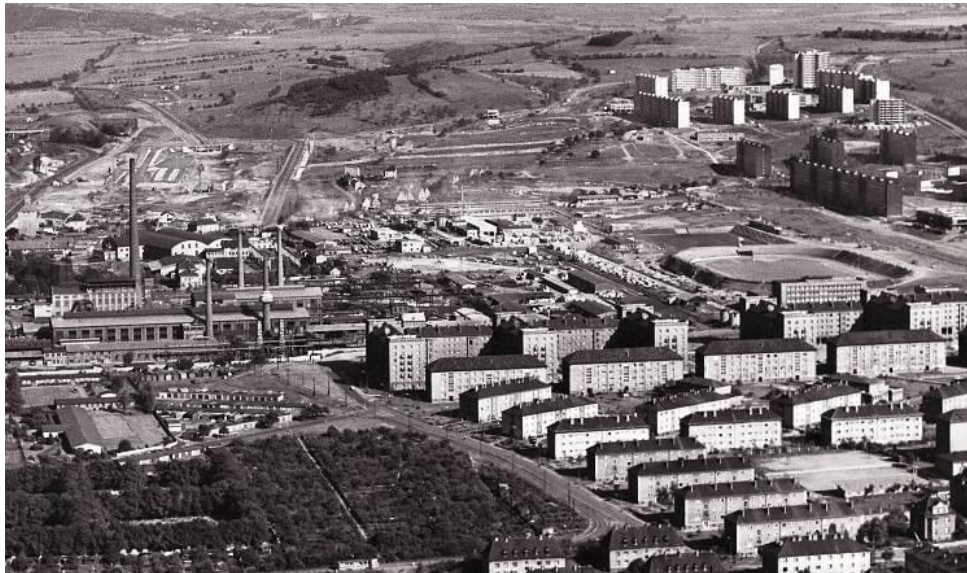
Obrázek 6.: Sídliště Podžatecká, vzadu vznikající obvod č.6 „pětistovky“ 51

hornické řadové domky vznikaly na vrstevnicích pod Širokým vrchem a byly odděleny příjezdovou komunikací do řad. Stalingradská čtvrť navazovala na historické Zahražany a byla vymezena hlavní Žateckou silnicí, za kterou začínal městský obvod č. 2 neboli sídliště Podžatecká.