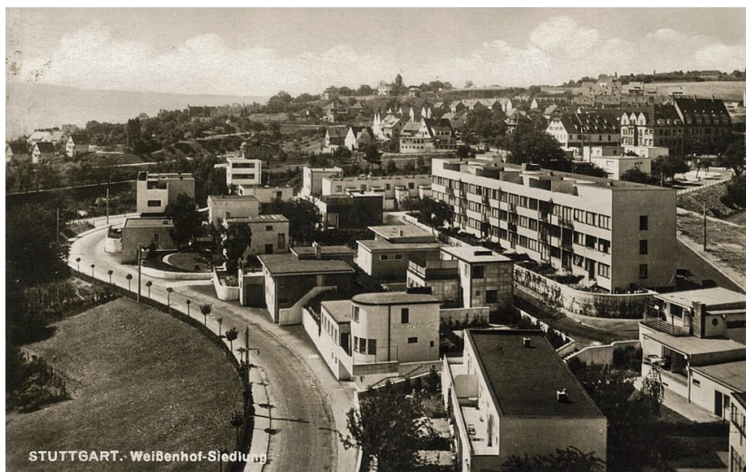
Obrázek 12.: Modernistické sídliště Weissenhof ve Stuttgartu. 101