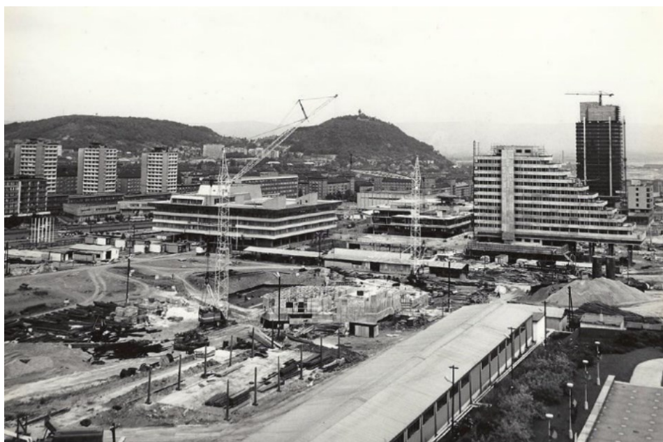
Obrázek 19.: Výstavba nového městského centra. 128

být schválen různými komisemi, organizacemi a mocenskými orgány, a finální podoba městského centra je spíše kompromisem.