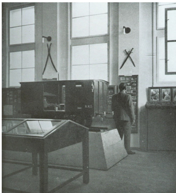
4. obraz – Fotografie expozice s výstavou o první světové válce i s modelem teplušky, r. 1937.