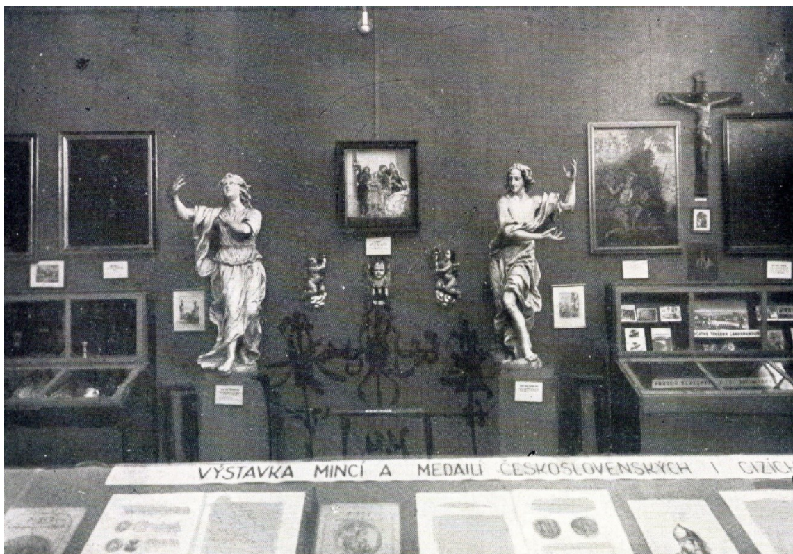
3. obraz – Fotografie z národopisné expozice Musea Novobenátecka v okresním domě, r. 1937.

St. inv. č. 15629.