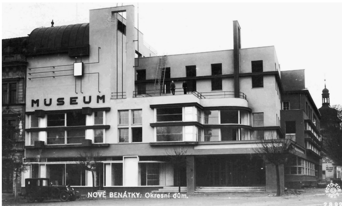
2. obraz – Pohlednice okresní dům v Nových Benátkách, 1. pol. 20. století.