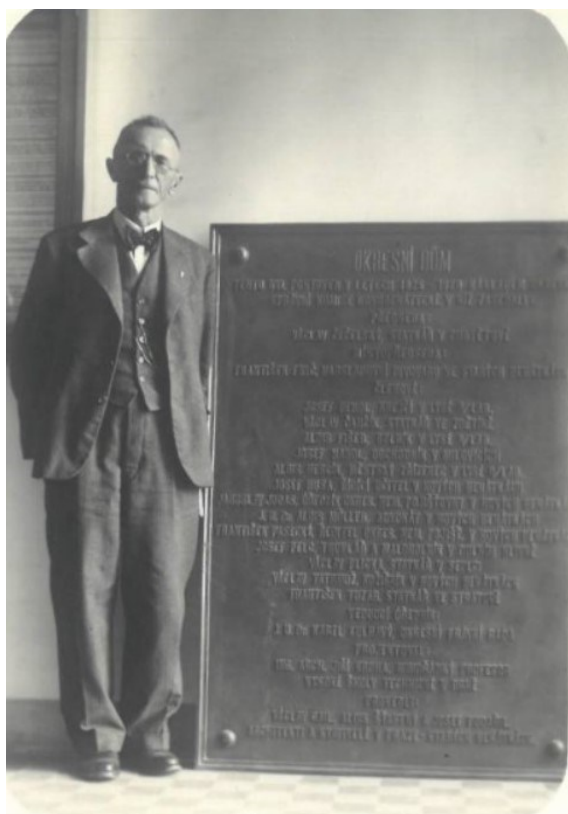
5. obraz – Fotografie Františka Paseckého, r. 1927. Zdroj: Muzeum Benátecka. Sběrka fotografií. Inv. č. MBJ-F-2055.