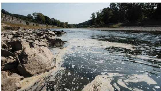
Obrázek 5 - MAFRA. Policie už oznámila, kudy s dostal kyanid do řeky Bečvy. Na kanál je ale napojeno mnoho společností. Online. In: lidovky.cz. Dostupné z: https://www.lidovky.cz/domov/kyanid-se-do-becvy-dostal-z-vyusteni-v-jurince-uvvedla-policie-na-kanal-je-napo