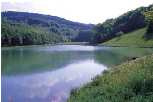
Obrázek 6 - VODNÍ STRÁŽCI. Vodstvo v ČR . Online. In: Vodní strážci. Dostupné z: https://vodnistrazci.cz/voda-v-prirode/vodstvo-v-cr