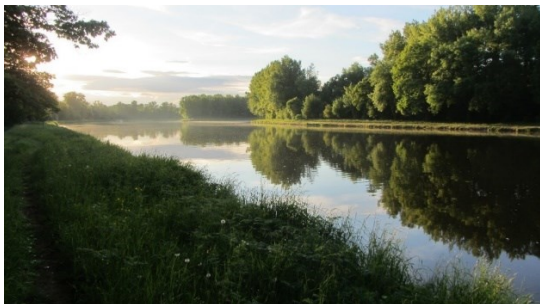
Obrázek 4 - LTER. Řeka Labe . Online. In: Lter. Dostupné z: https://www.lter.cz/reka-labe