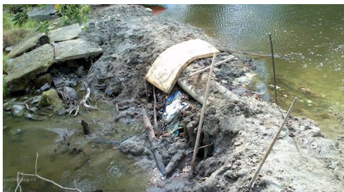
Obrázek 7 - SUCHÉ JEZY CZ. Řeka Radbuza, říční km 24,6, povodí Vltavy. Online. In: suchejezy.cz . Dostupné z: https://www.suchejezy.cz/jez-Reka-Radbuza-ricni-km-246-Povodi-Vltavy.aspx?ID=201