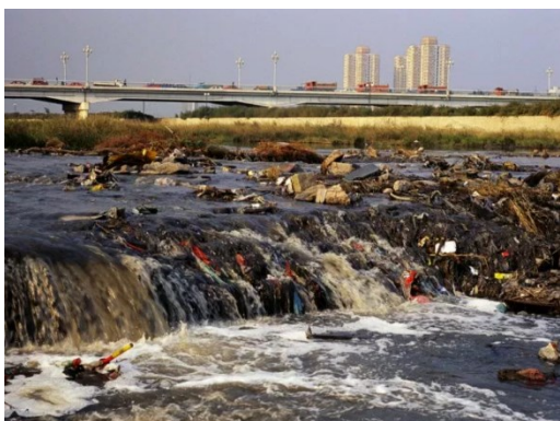
Obrázek 11 - ILSANTERELLINO.WORDPRESS.COM. Je znečištění řek globální problém? Zde je seznam 8 nejvíce znečištěných řek světa. Online. In: Hydrotech. Dostupné z: https://www.hydrotech-group.com/cz/blog/8-najzncistenejsich-riek-na-svete