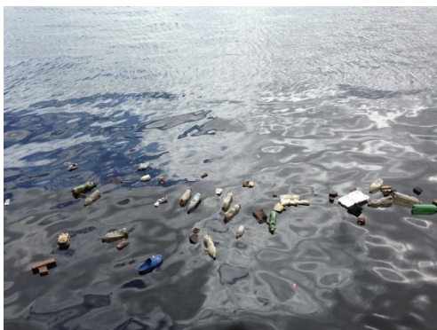
Obrázek 8