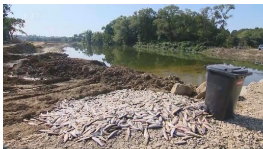
Obrázek 1 - ČT 24. Facebookový příspěvek o otravě Bečvy. Online. In: Facebookový profil Události Ostrava. Dostupné z: https://www.facebook.com/photo/?fbid=3514764271891896&set=a.238588429509513