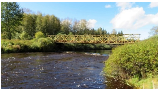
Obrázek 10 - HOTELOVE. Vltava je s 430 km nejdélší řeka České republiky. Online. In: hotelove.cz 16.3.2021. Dostupné z: https://hotelove.cz/reka-vltava/