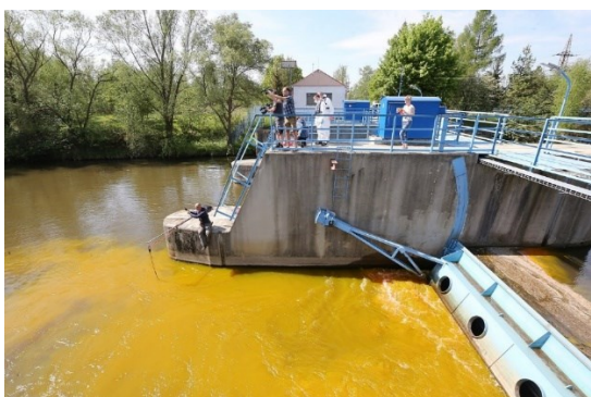
Obrázek 9 - IDNES.TV. Řeka Bílina změnila barvu. V korytu probíhá speciální stopovací zkouška. Online. In: Idnes.cz 11. 5. 2022. Dostupné z: https://www.idnes.cz/usti/zpravy/reka-bilina-stopovaci-zkouska-povodi-ohre-specialni-barvivo.A220511_123525_usti-zpravy_pri