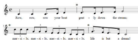
Obrázek 3 - notový zápis písně „ Row, row row your Boat “ (Mysid, 2012 in Wikipedia)

Roll, roll, roll your joint Twist it at the ends You light it up, you take a puff And then you pass it to your friends.