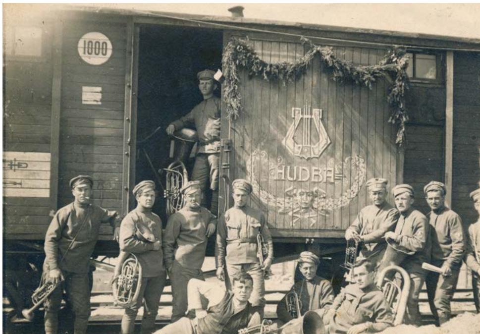
Část příslušníků plukovní hudby 7. čs. střeleckého pluku před vyzdobenou těpluškou. Místně neurčeno, 1918 (sbírka autora).

povětšinou jakési „exkluzivní“ pochody konkrétních útvarů, zpravidla zkomponované některým z příslušníků. 30 Mimo to byly do služebního repertoáru započítány i hymny a další hudební kusy (během působení v rámci ruské armády například chorál Kol Slaven , hraný k večerní modlitbě). 31 Koncertní repertoár byl o poznání pestřejší. Jednalo se o nejrůznější hudební kusy, často například přede hry či směsi z oper a operet. Nejvíce byl ovšem určován dostupností hudebnin. Hudby v mnoha případech uváděly nejen díla českých, ale i světových klasiků. Čeští hudební skladatelé byli z pochopitelných důvodů preferováni, skladeb zahraničních autorů se ovšem nacházelo v repertoáru plukovních hudeb nemalé množství. Objevovala se přitom i díla německých autorů (kupříkladu Richarda Wagnera), 32 což může ve zcela protiněmecky smýšlejícím vojsku působit až zarážejícím dojmem. Mimo to plukovní hudby často hrály taneční kusy — zejména valčíky a polky, 33 které byly zvláště oblíbené už jen z důvodu socializačního aspektu tanečních zábav.