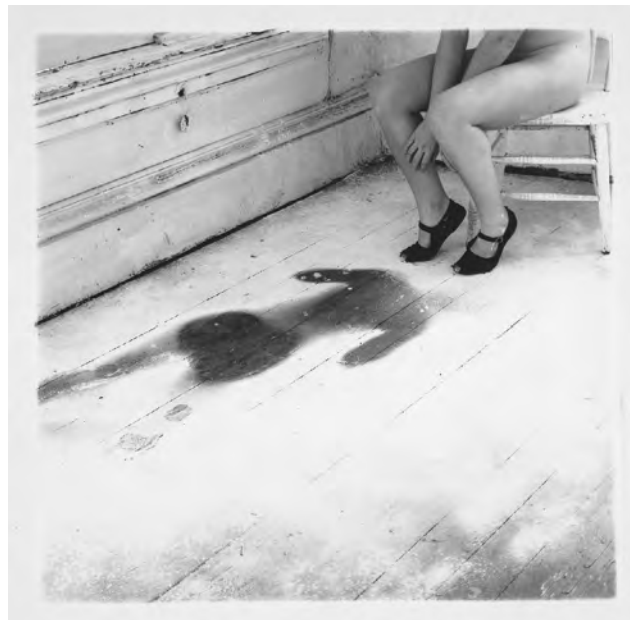
Francesca Woodman, Autoportrét (1976)

Snaha získat od sebe odstup a možnost zkoumat vztah k vlastnímu tělu byly a jsou motivací pro řadu autorů a autorek. Jednou z nich byla americká fotografka Francesca Woodman (1958–1981), která fotila surrealistické, humorné a někdy až bolestně upřímné obrazy sebe sama. Během svého krátkého života vytvořila na 800 snímků, na nichž ji obvykle vidíme napůl skrytou nebo zastřenou – někdy nábytkem, jindy pomalou expozicí, která její postavu rozostřuje do přízračné podoby. Na otázku, proč se stala objektem vlastních fotografií odpověděla: „Je to otázka pohodlí, jsem totiž vždy k dispozici.“ 3