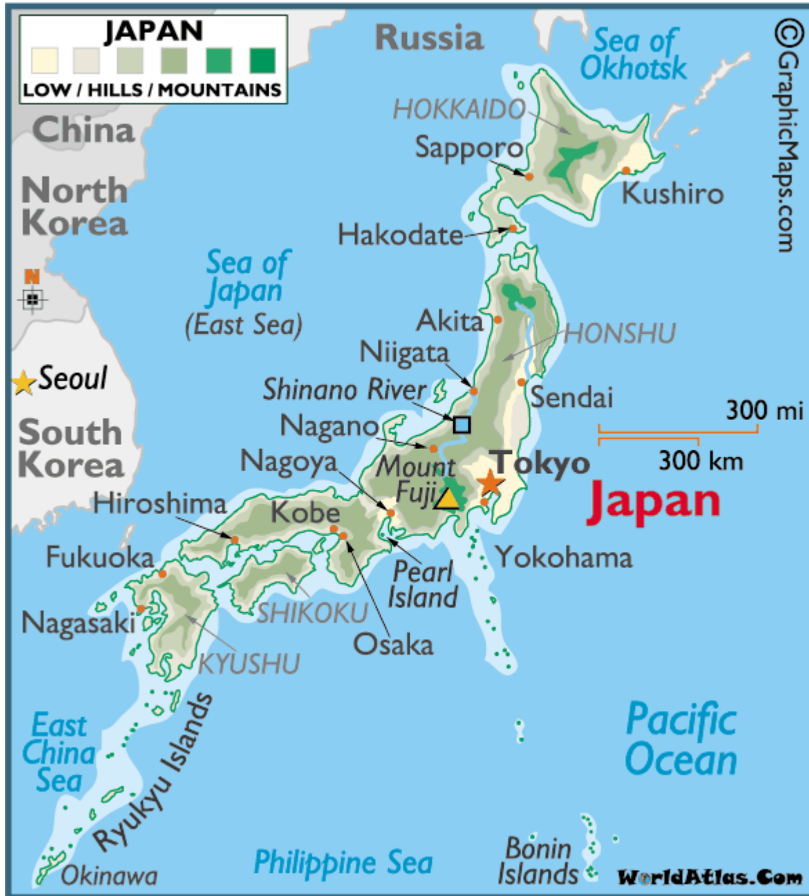
Příloha č. 1: Mapa Japonska 99