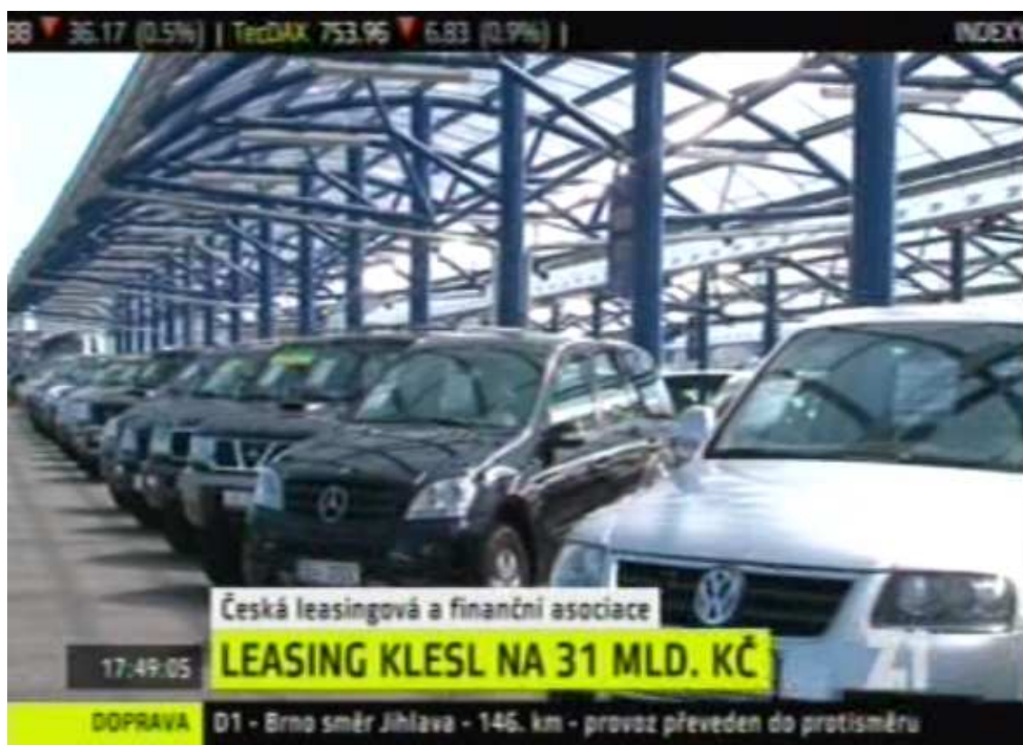
Příloha č. 11: Grafika v Událostech ČT24 (obrázek)