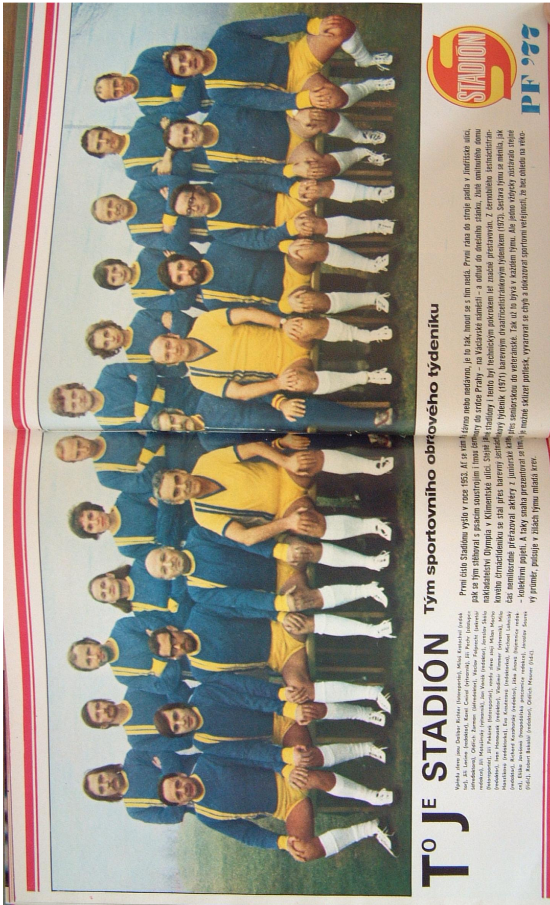
Příloha č. 5: Redakce Stadiónu – 1977 (obrázek)