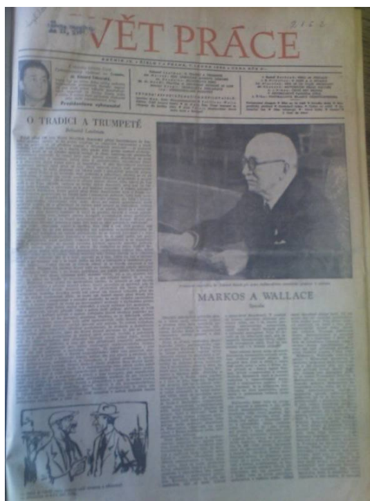
Příloha č. 2: Titulka 2 (obrázek)