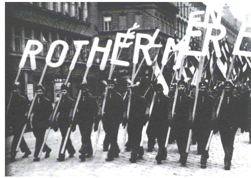
Přehlídka maďarského vojska v r. 1927