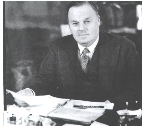
Lord Rothermere v r. 1939