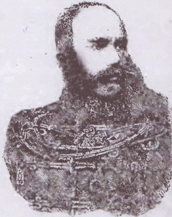
František Josef I.

Vydávají se každou sobotu. — Redakce, administrace a expedice jest v Brně na Velké Pekařské ulici č. 23 ve přízemí. — Předplatné činí celoročně 5 zl., půlročně 2 50 zl., čtvrtročně 1 25 zl. Jednotlivá čísla prodávají se, pokud v zásobě jsou, po 10 kr. — Všecky dopisy a záležitosti týkající se buď redakce buď administrace budiž laškově frankovány. — Reklamae se nepřebíjí a nefrankují. — Inseráty počítají se za cenu levnou. — Upomínky jdou na účet odběratelův. — Odběratelství přestává toliko výslovnou výpovědí u administrace „Vojenských Listů.“