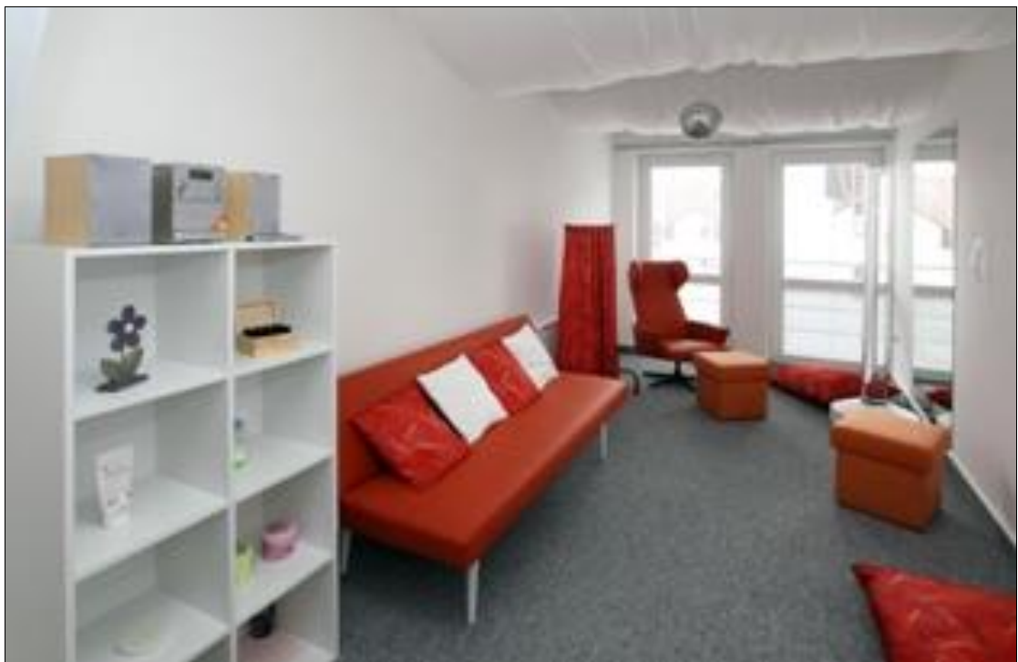
Příloha č. 2: Pohled od dveří, místnost bez zatemnění.