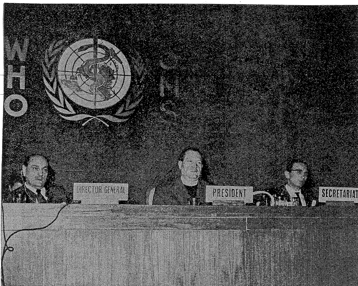
Příloha č. 3 Fotografie Josefa Plojgara ve funkci předsedy 14. zasedání Světové zdravotnické organizace v Dillí