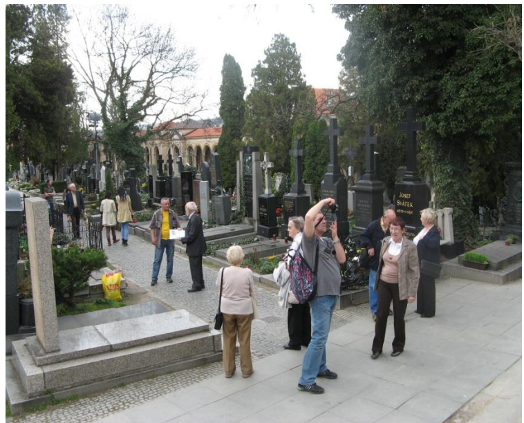
Obrázek 14 Turisté na vyšehradském hřbitově