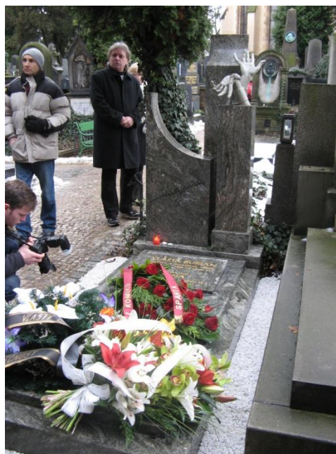
Obrázek 9 Vzpomínka u hrobu Vlasty Buriana