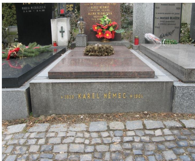
Obrázek 5 Způsob zápisu jména původního „nájemce“ hrobu