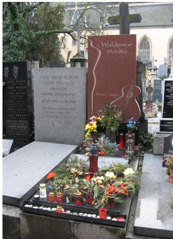
Obrázek 6 Hrob Waldemara Matušky s výzdobou

Díky různé výzdobě hrobů lze na hřbitově sledovat, jak se mění roční doby a jaké svátky se blíží nebo v nedávné době minuly. V době dušiček a obecně na podzim na hřbitově převažovaly zapálené svíčky, květiny kvetoucí na podzim či jednodušší věnce. Čím víc se nicméně blížily Vánoce, tím více se na hrobech začínala objevovat výzdoba s neutrálními zimními motivy, například postříbřené věnce z větví jehličnatých stromů a ozdobené šíškami nebo ozdoby s jasně vánočními motivy. Mezi ozdoby s jasně vánočními motivy patřily různé dekorativní dárčky vyskládané na hrobě, často byla na hrobě nějakým způsobem naaranžovaná větev, která byla