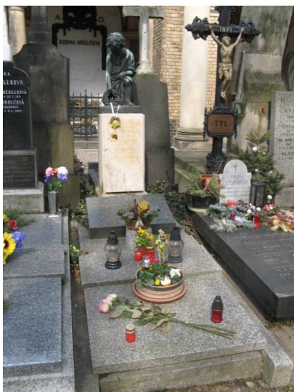
Obrázek 8 Hroby s velikonoční výzdobou

Dalším obdobím, které „nutí“ měnit živé majitele hrobů k nové proměně jsou Velikonoce. Jak jsem zmínila, tak asi především díky počasí mi tato proměna hřbitova přišla o něco více „nárazová“ než postupná proměna výzdoby z podzimní na zimní a vánoční. Pár hrobů bylo ozdobeno, dalo by se říci jarně, s jistým předstihem, největší proměnou však hřbitov prošel těsně před Velikonocemi a během velikonočních svátků. Na hrobech se objevila jasně velikonoční výzdoba v podobě zajíčků z různých materiálů, vajíček z různých materiálů zavěšených na desku hrobů či na větvičky umístěných na hrobě apod..