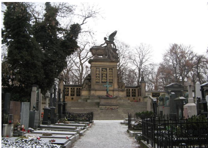
Obrázek 3 Slavín na vyšehradském hřbitově