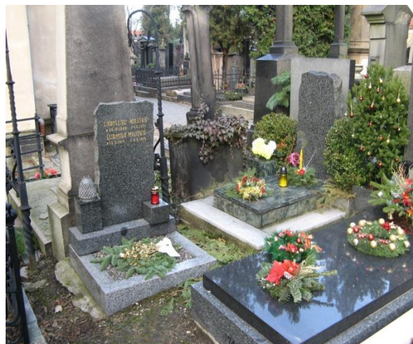
Obrázek 7 Hroby s velikonoční i vánoční výzdobou

Na hrobech se ukázala i jistá neutrální jarní výzdoba, která pak po skončení Velikonoc začala převažovat a to nejčastěji v podobě čerstvě vysázených jarních květin jako jsou macešky nebo tulipány. Na několika hrobech se pomalu se probouzející jaro začalo ukazovat již těsně před Velikonocemi, kdy na několika hrobech v menším či větším množství rozkvetly sněženky. Nicméně i v době Velikonoc či pár týdnů po Velikonocích se dalo na hřbitově najít několik hrobů, které na sobě měly vánoční či zimní výzdobu, často se pak lehce tloukla výzdoba u dvou hrobů vedle sebe, kdy jeden byl ozdoben velikonočně a druhý vánočně.