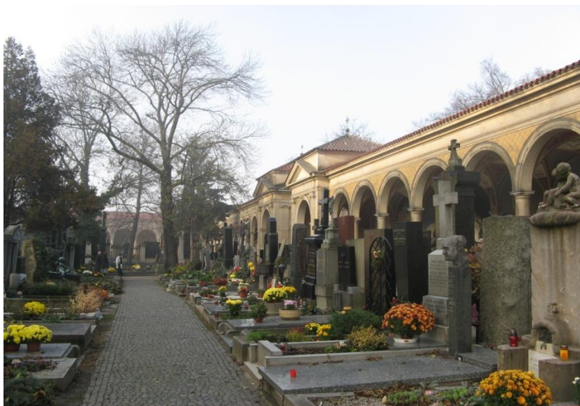
Obrázek 1 Vyšehradský hřbitov a arkády

myšlenka proměny vyšehradského hřbitova v národní pohřebiště, o což se zasloužili ve velké míře především čeští obrozenci. Myšlenka vznikla ve vlasteneckém spolku Svatobor, který byl založen roku 1862 a to z iniciativy historika