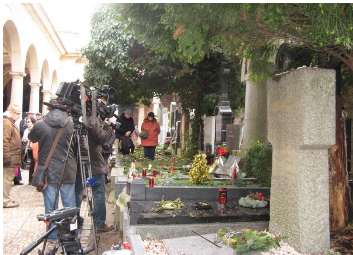
Obrázek 10 Pietní akt u hrobu Karla Čapka

Při příchodu východním vchodem jsem nejdříve zakopla o pár drátů, u kterých jsem po pár metrech pochopila, že jsou vedeny právě k hrobu Karla Čapka. Protože jsem byla na hřbitově s časovým předstihem před zahájením pietního aktu, tak jsem se šla nejdříve po hřbitově projít a zjistit, jakou vánoční proměnou prošla značná část hrobů. Asi deset minut před