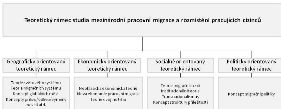
Schéma 2: Teoretický rámec studia mezinárodní pracovní migrace a rozmístění pracujících cizinců