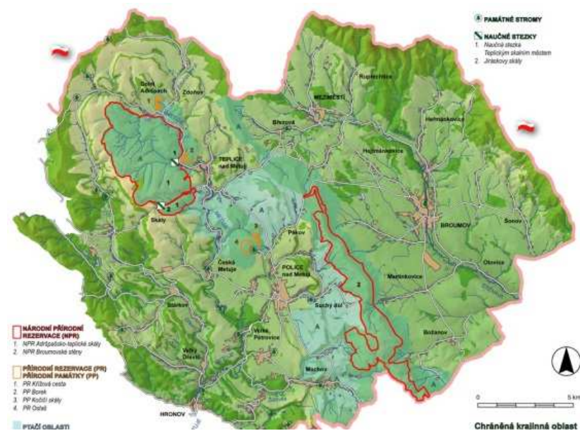
Obrázek 3 Region Broumova

Region Broumova, který bylo v rámci této analýzy využito jako příklad, se nachází přibližně 250 km severovýchodně od Prahy na hranicích s Polskem v oblasti tzv. Broumovského výběžku. Historicky se jedná o území náležící do oblasti Slezska a později do tzv. Sudet, stejně jako rozsáhlá území celého pohraničí ČR. Právě skutečnost, že většina obyvatel byla německy hovořících, měla za následek výrazné vylidnění po odsunu v roce