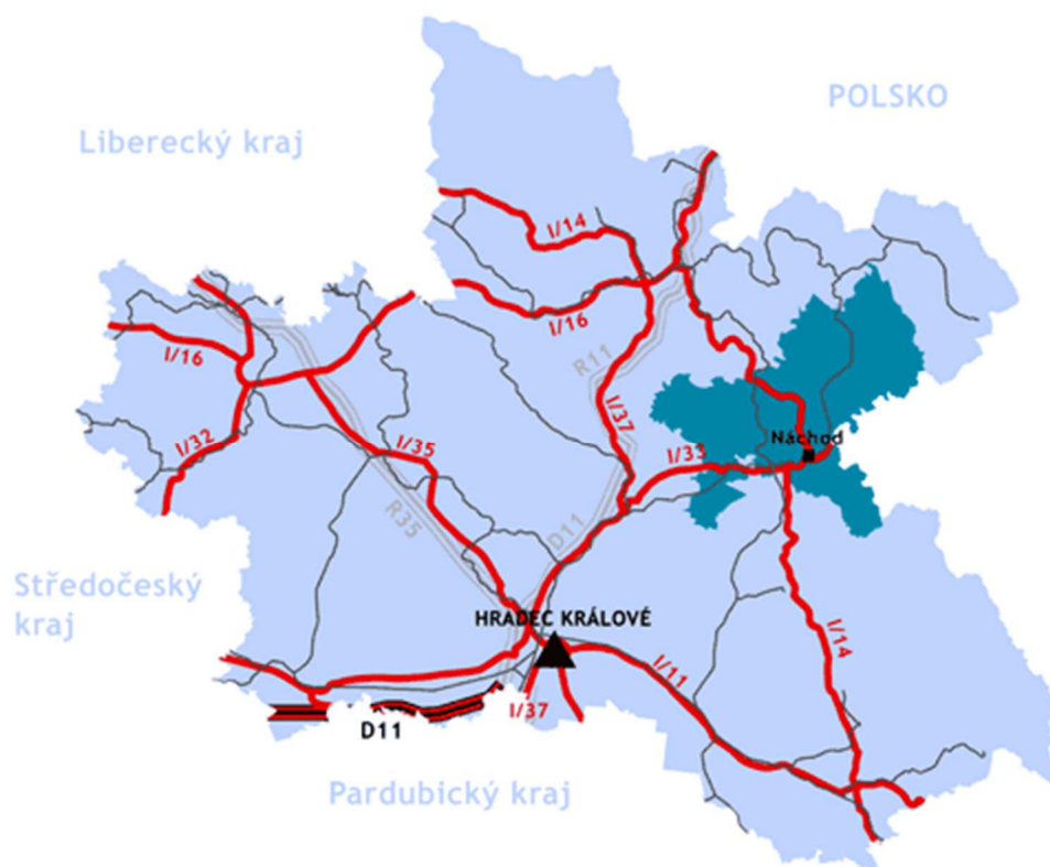
Obrázek 2 Dopravní síť Královéhradeckého kraje, kde je dobře vidět, že se důležité silnice označené červeně Broumovsku vyhýbají.

Jak je vidět z výše uvedené mapy Eurostatu i z dostupných informací, Broumovsko splňuje všechny tyto tři základní podmínky. Podívejme podobně na jednotlivé body.