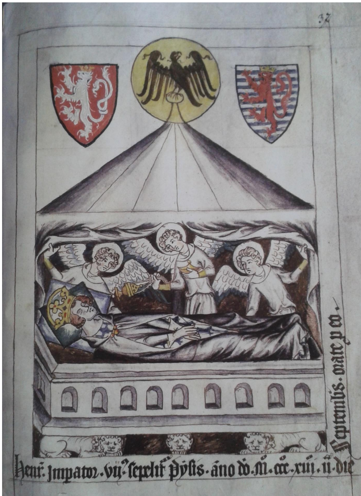
17. Codex Balduini/Balduineum , kol. 1340, pohřbení Jindřicha VII. v Pise 2. září 1313, nad hrobem se vznášejí znaky českého lva, lucemburské lvice a císařské orlice