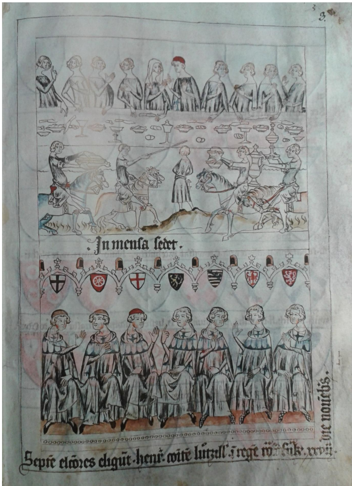
5. Codex Balduini/Balduineum, kol. 1340, zasedání u tabule