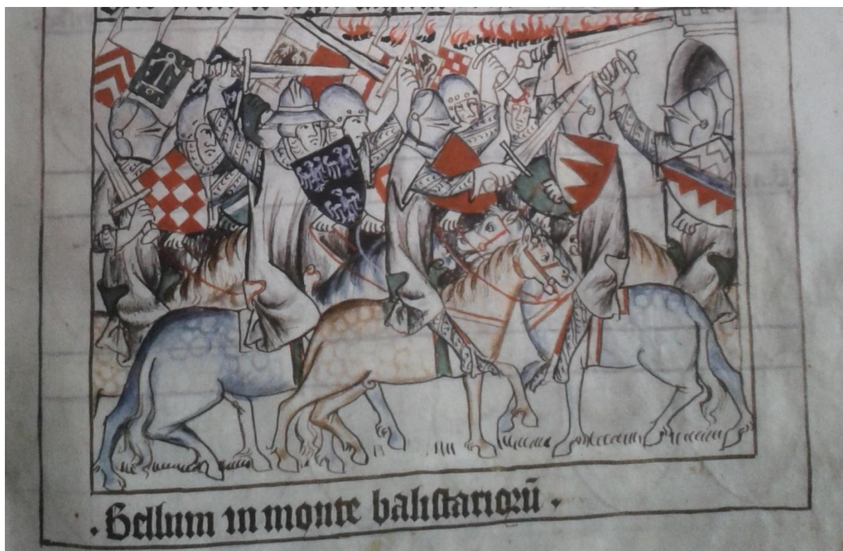
13. Codex Balduini/Balduineum , kol. 1340, ukázka jedné z mnoha v kodexu zobrazených bitev, dobývání italských měst Jindřichem VII.