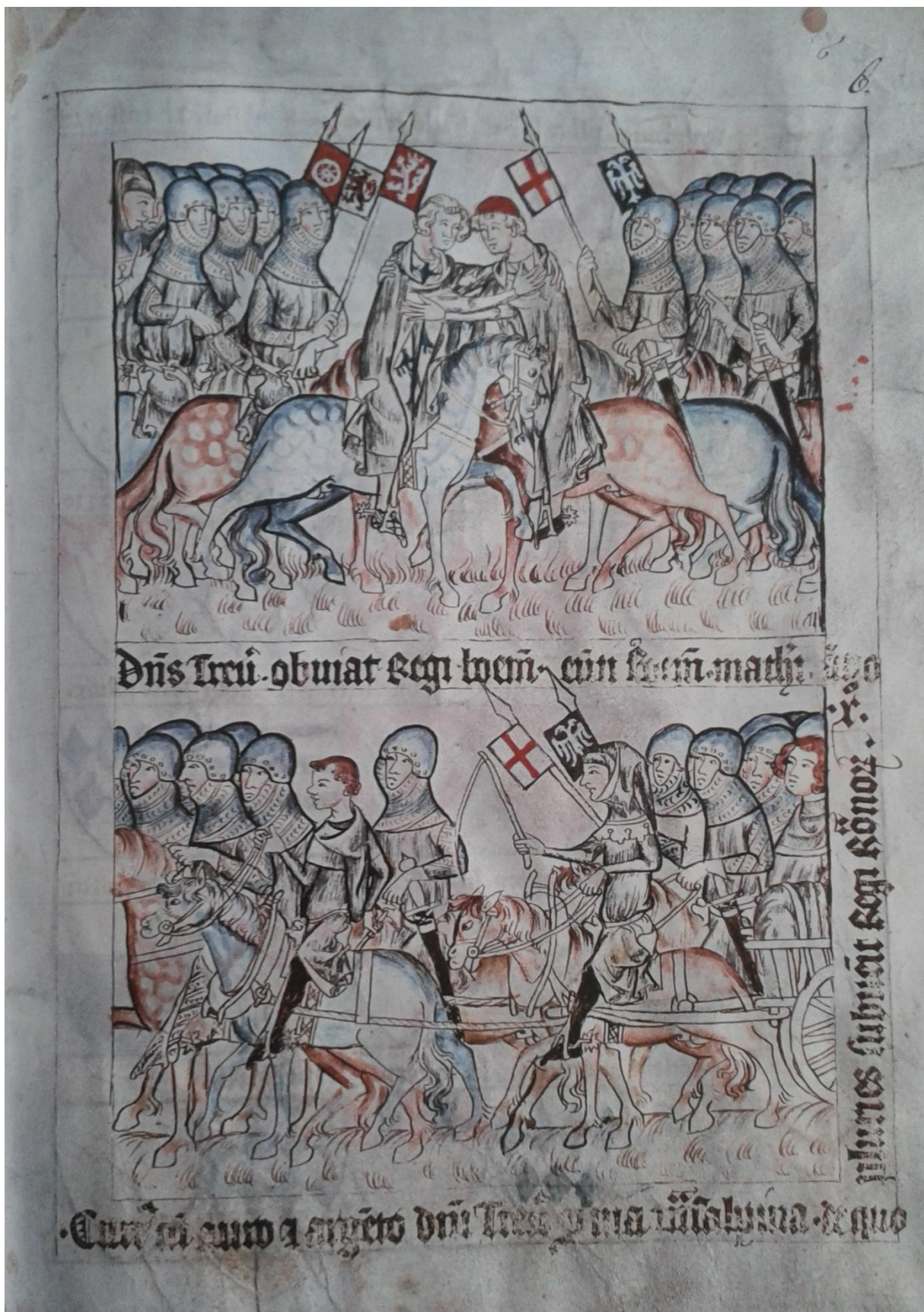
11. Codex Balduini/Balduineum, kol. 1340, setkání Balduina Trevírského a Jana Lucemburský roku 1310