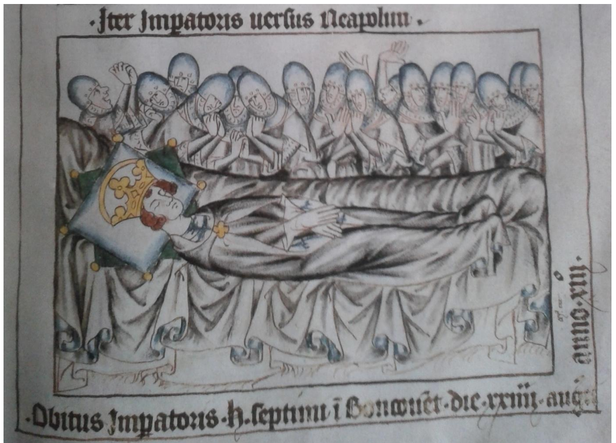
16. Codex Balduini/Balduineum, kol. 1340, smrt Jindřicha VII. 24. srpna 1313