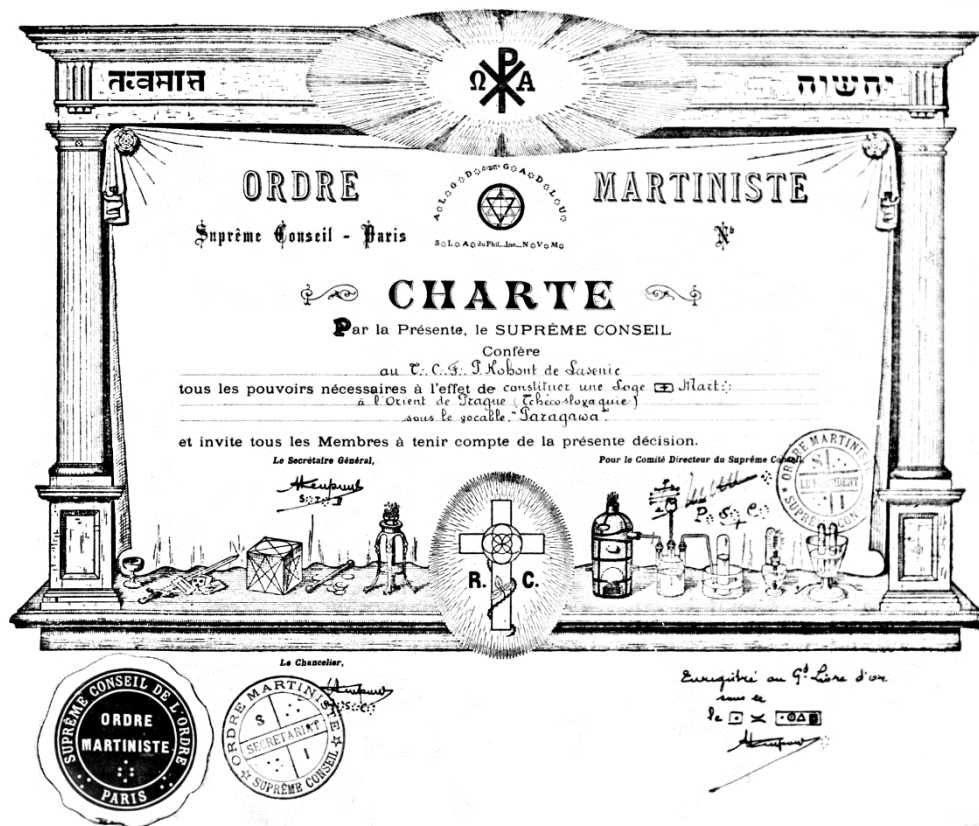
Obr. 3 Charta vystavená P. de Lasenicovi pro založení lóže Paragawa