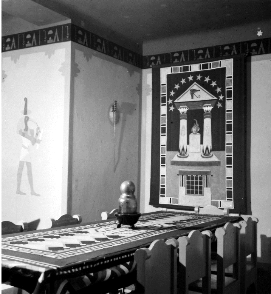
Obr. 5 Interier vily v Káraném u Prahy

Srdečné blahopřání ke vašímu výročí a mnohé štěstí ve vašich cestách měj :