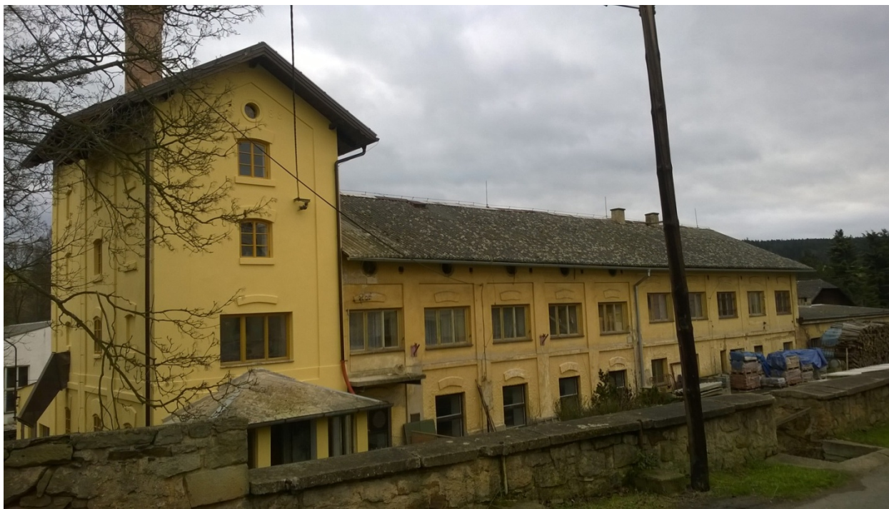
Chátrající budova bývalého hotelu