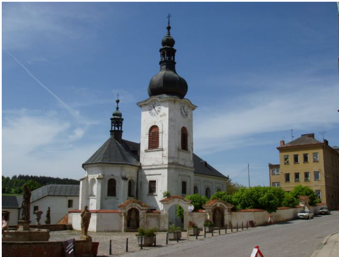
Kostel sv. Barbory a benzinová pumpa u silnice vedoucí od Plzně