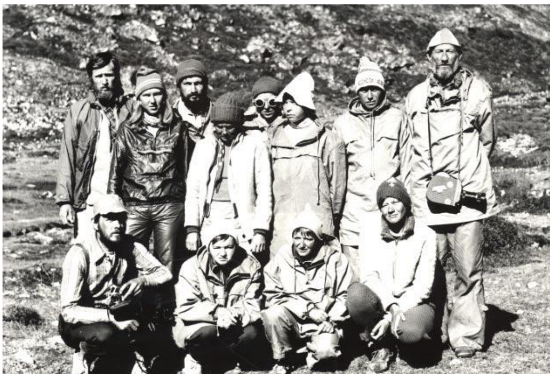
Společná fotografie z první ženské horolezecké expedice do Himaláje, Nepál 1980. 252