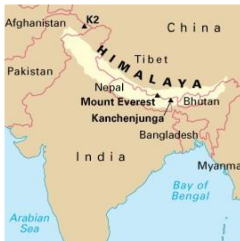
Obrázek 12: Pohoří Himaláje - V tomto pohoří se nachází deset ze čtrnácti nejvyšších vrcholů světa, tzv. osmitisícovek. Oblast zasahuje na území Pákistánu, Číny, Indie, Nepálu a Bhútánu. 216

jsou taky, ale tehdy to bylo ještě horší. To se kupovali načerno marky u veksláků...no bylo to náročné. Pak byly zájezdy horolezeckého svazu, tvrdě vybojované..." Rozhovor s Lenkou Benešovou vedla Barbora Kramářová, 31. 3. 2015, s. 4.