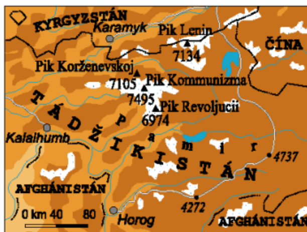
Obrázek 11: Pamír - rozsáhlý horský masív v dnešních hranicích v Tádžikistánu, Afghánistánu a Číně. 215