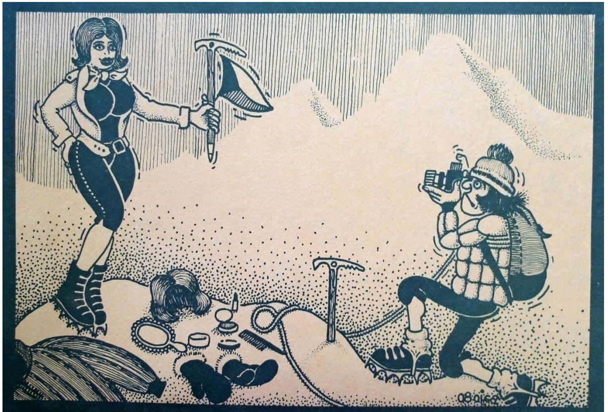
Obrázek 13: Ilustrace z knihy o první československé ženské expedici do Himaláje. 243