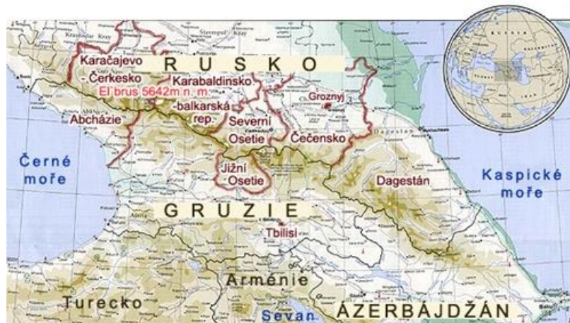
Obrázek 10: Pohoří Kavkaz – Dříve součást SSSR, dnes se pohoří táhne podél rusko-gruzínsko-ázerbájdžánských hranic. 214