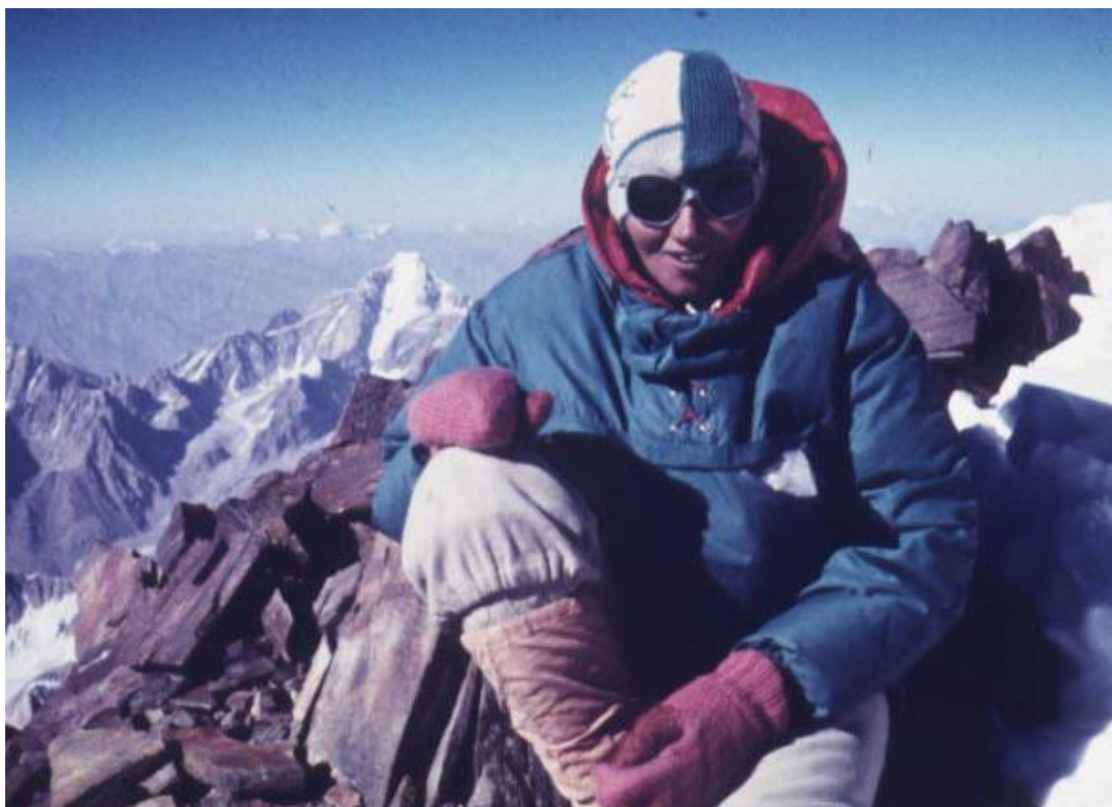
Dina Štěrbová na vrcholku Afghánské hory Noshag, Afghánistán 1977. 251