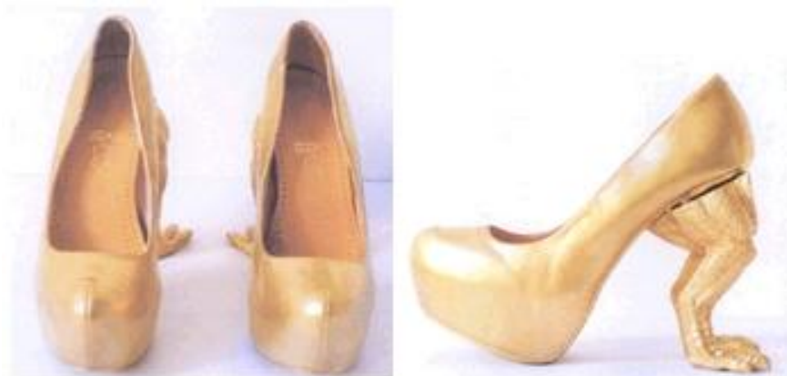
Obr. 1: Módní obuv značky Awkward Collection zapsaná jako průmyslový vzor