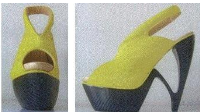
Obr. 2: Jeden z průmyslových vzorů původce Zuzany Serbákové