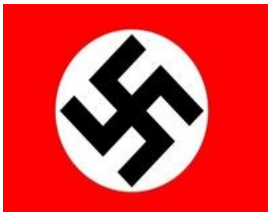
vlajka Německa z let 1935 - 1945