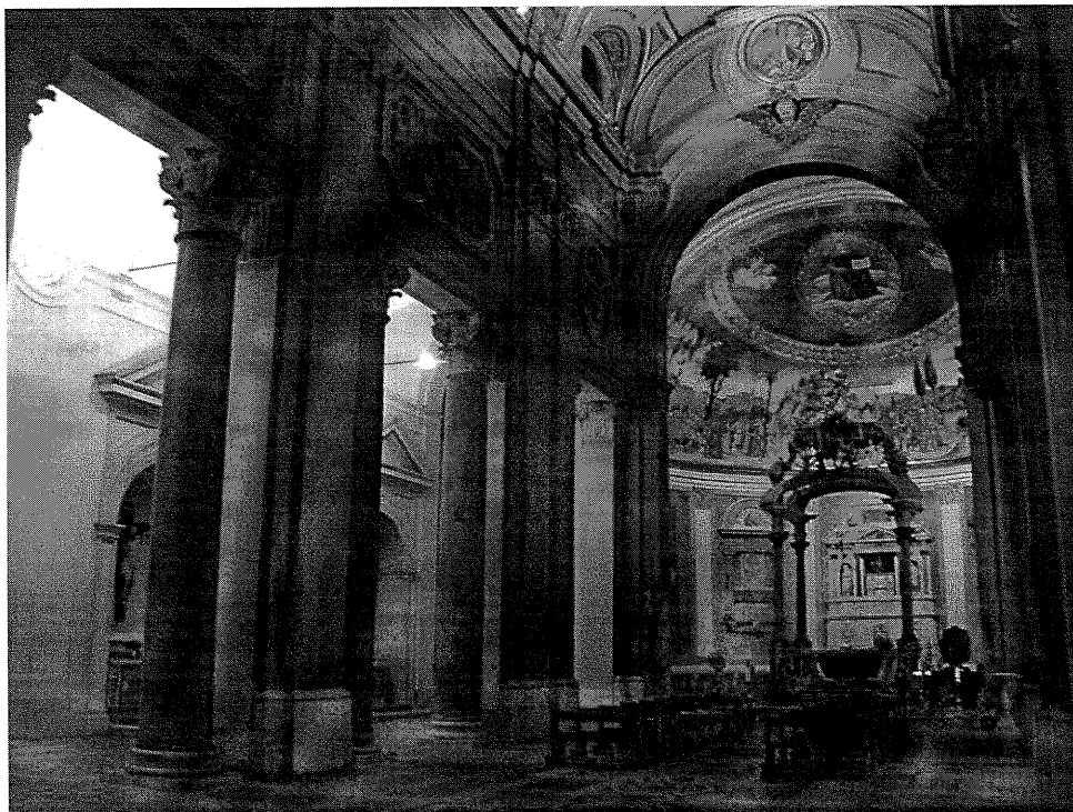
71) Současný pohled do interiéru baziliky sv. Kříže z 18. století (foto autor).