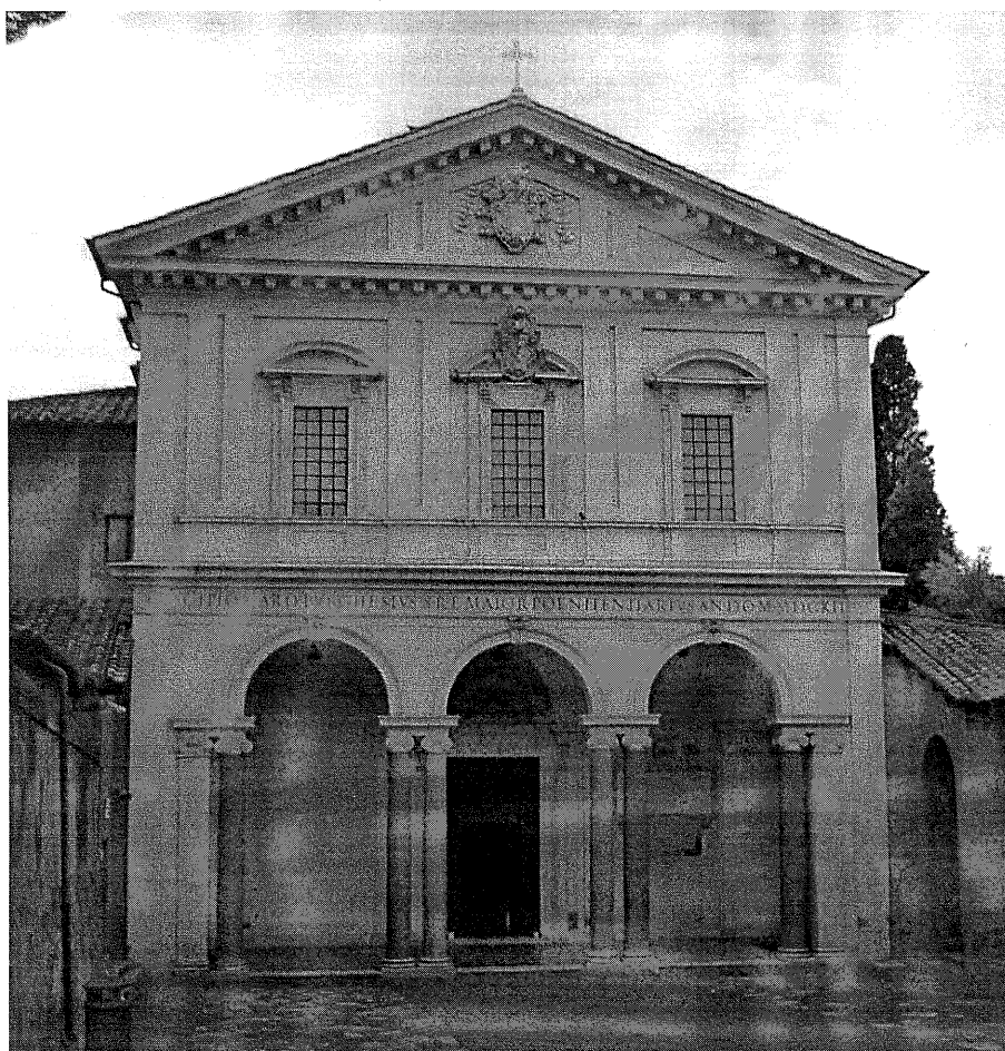
73) Současné východní průčelí baziliky sv. Šebestiána zbudované při velké přestavbě roku 1612.