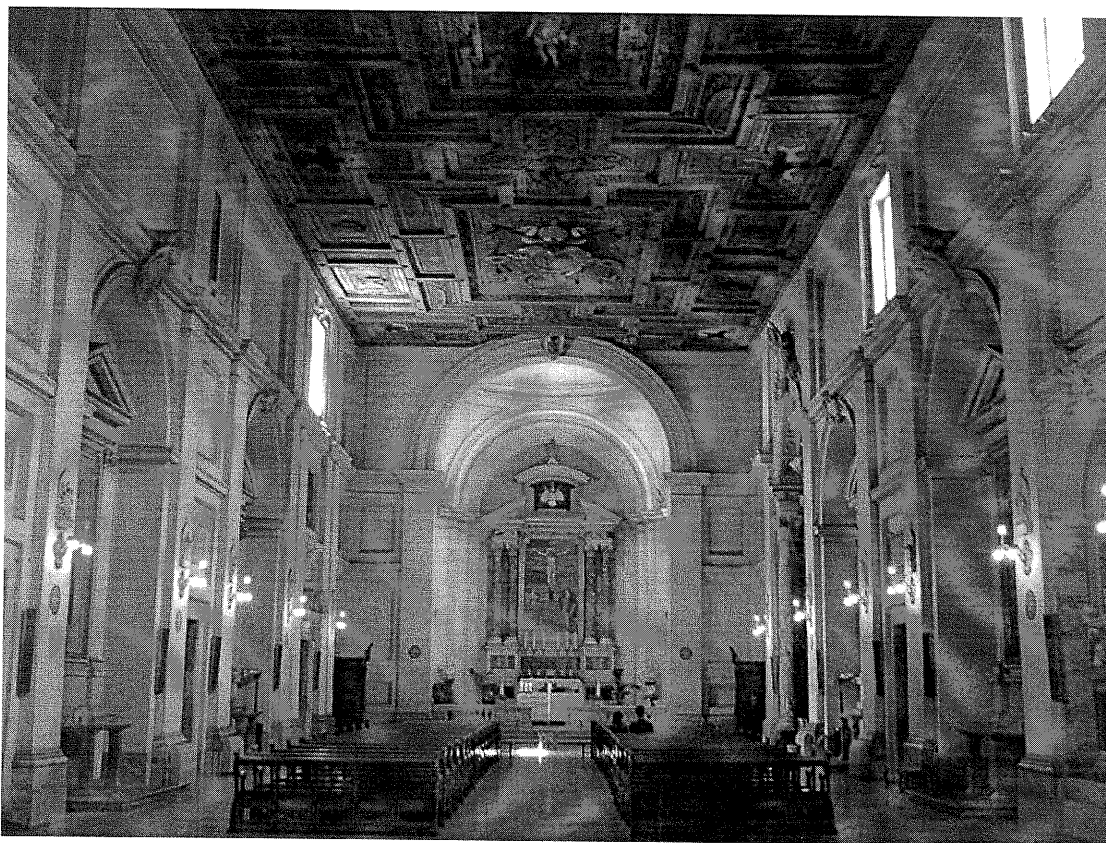
74) Současný pohled do interiéru baziliky sv. Šebestiána ze 17. století.