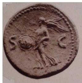
Obr. 31. Victoria se štítem ctnosti