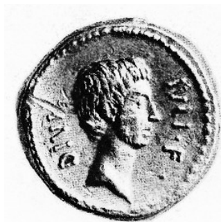
Obr. 6. Ražba s Fortunou, kterou Octavianus okopíroval od Marca Antonia