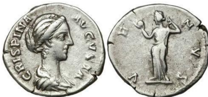
Obr. 62. Avers - Bruttia Crispina, Revers - Venuše s jablkem