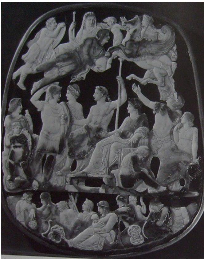
Obr. 16. Velká francouzská kamej