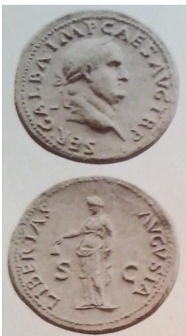
Obr. 34. Galba a Libertas