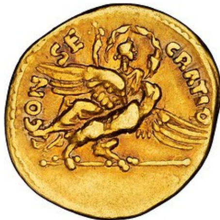
Obr. 50. Sabina na orlovi