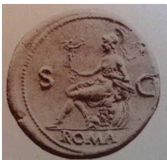
Obr. 32. Roma