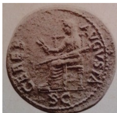
Obr. 27. Ceres Augustae