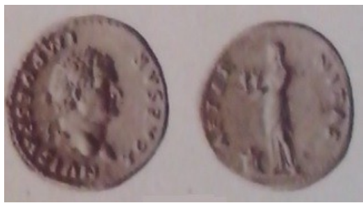
Obr. 38. Vespasianus a Aeternitas