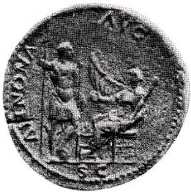
Obr. 36. Vitellius a Annona