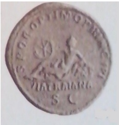
Obr. 49. Via Traiana