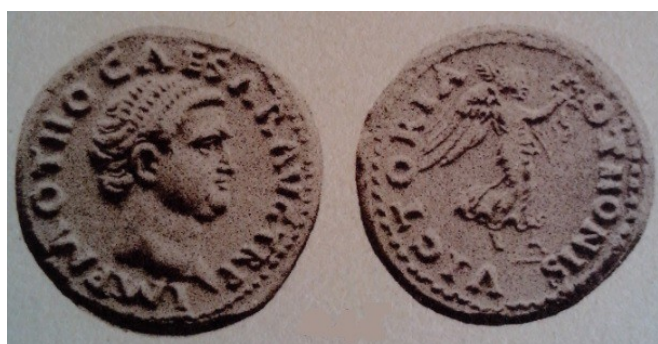
Obr. 35. Otho a Victoria