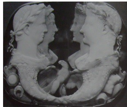
Obr. 21. Svatební kamej