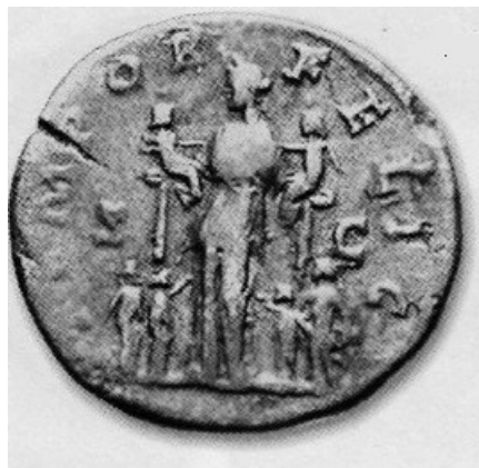
Obr. 59. Faustina Minor se svými šesti dětmi