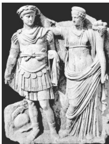
Obr. 29. Nero a Agrippina, Sebasteion