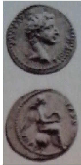
Obr. 15. Victoria na glóbu, tiberiovská ražba