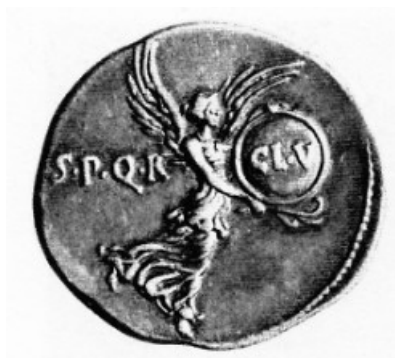
Obr. 8. Victoria se štítem ctností