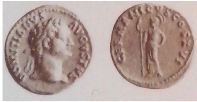
Obr. 43. Domitianus a Minerva