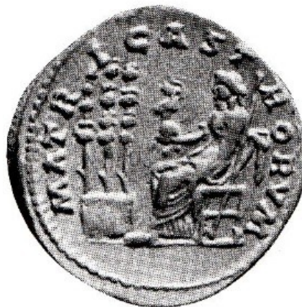
Obr. 60. Faustina Minor jako Mater Castrorum