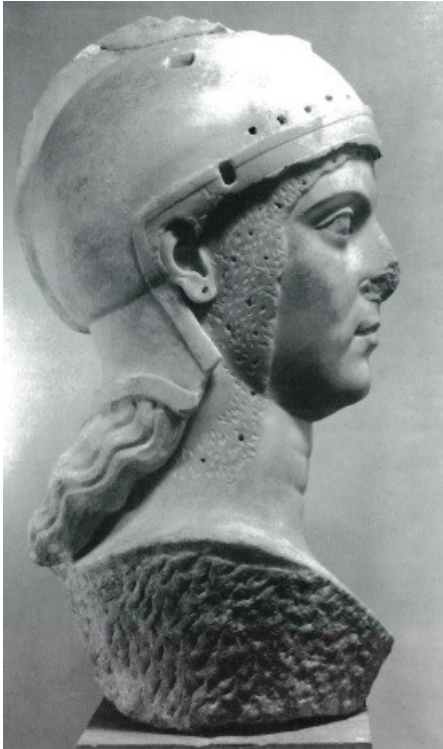
Obr. 63. Iulia Domna jako Athéna/Minerva