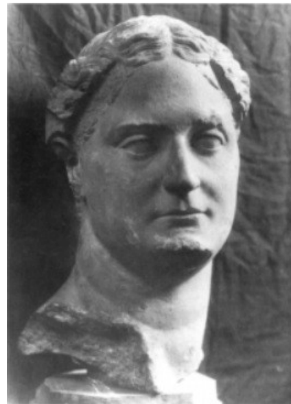
Obr. 45. Busta Minervy s Domitianovými rysy