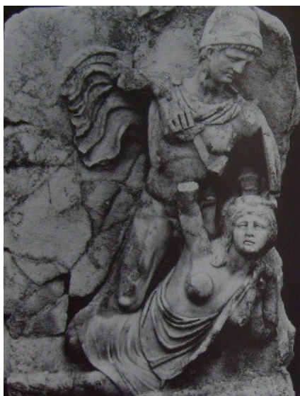
Obr. 24. Claudius a Britannia