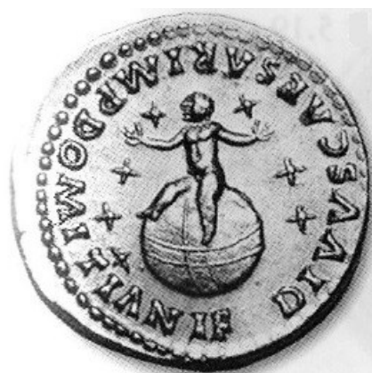
Obr. 41. Domitianův zbožštěný syn na glóbu