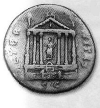
Obr. 56. Chrám Faustiny Maior s její sochou