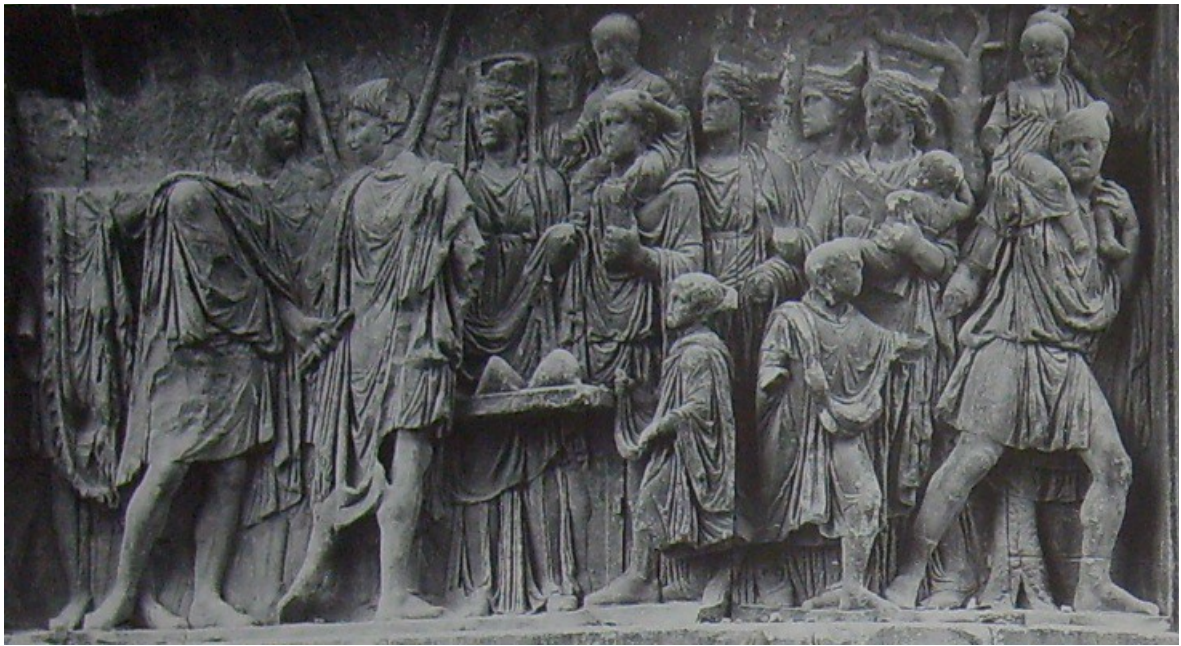
Obr. 48. Traianus před městskými bohyněmi, Beneventum