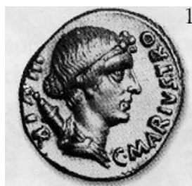
Obr. 10. Diana s Augustovými rysy?