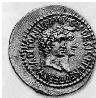
Obr. 2. Jedna z nejstarších římských mincí s portrétem žijící ženy (Octavia a Marcus Antonius), mincovna v Efesu