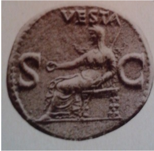
Obr. 18. Vesta - ražba z doby Caliguly