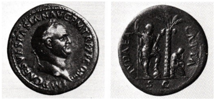
Obr. 37. Vespasianus a Iudaea Capta