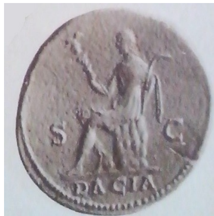
Obr. 52. Dacia