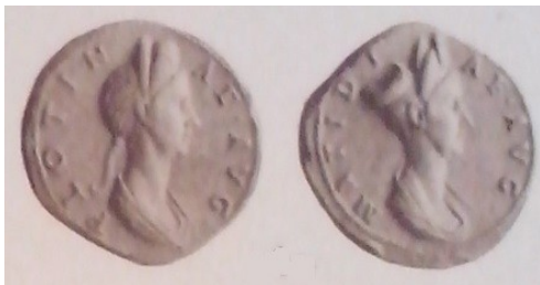
Obr. 46. Plotina a Matidia