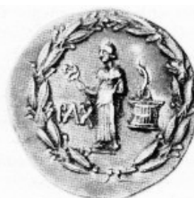
Obr. 9. Na reversu bohyně Pax s caduceem, mincovna v Efesu