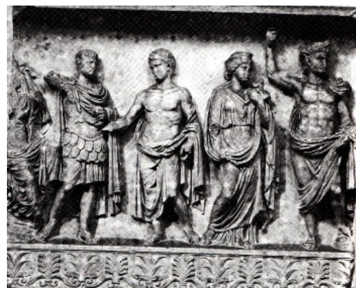
Obr. 23. Reliéf z Ravenny