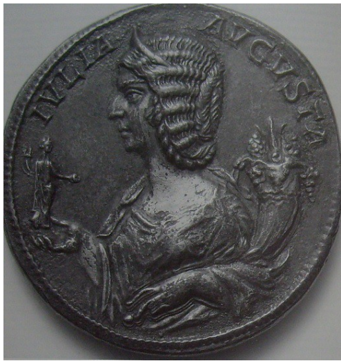
Obr. 65. Iulia Domna s atributy plodnosti