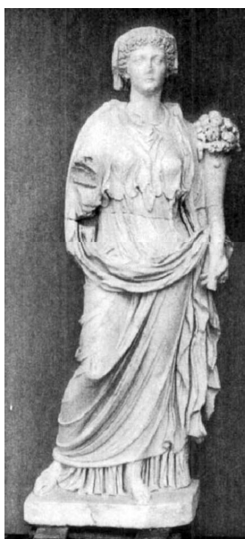
Obr. 22. Livia s rohem hojnosti, Neapolský záliv