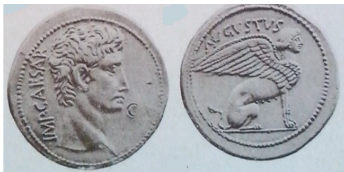
Obr. 12. Augustus se sfingou