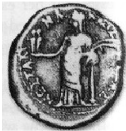
Obr. 20. Messalina sa soškami svých dětí