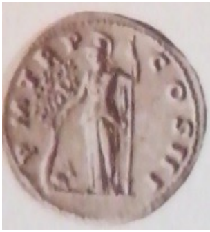
Obr. 53. Minerva a pasoucí se králík