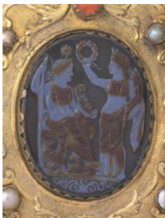
Obr. 30. Agrippina dává Neronovi věnec, kamej z Kolína nad Rýnem