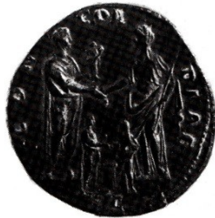
Obr. 54. Svatba před sochami Antonina Pia a Faustiny Maior