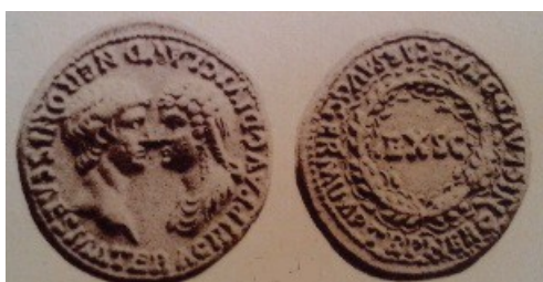
Obr. 28. Nero a Agrippina naproti sobě