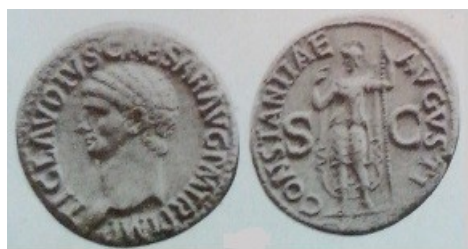
Obr. 25. Avers - Claudius, Revers - Constantia ve zbroji