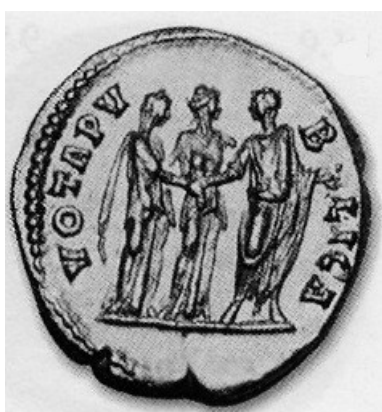
Obr. 61. Concordia mezi Marcem Aureliem a Faustinou