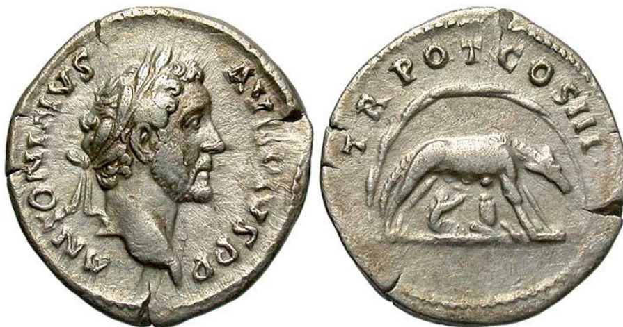
Obr. 57. Avers - Antoninus Pius, Revers – Vlčice