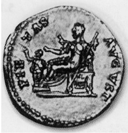
Obr. 42. Domitia jako Pax