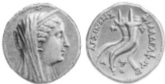
Obr. 1. Arsinoé s miniaturním beraním rohem, Britské muzeum