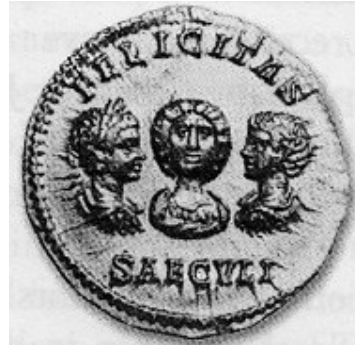
Obr. 64. Iulia Domna se svými syny