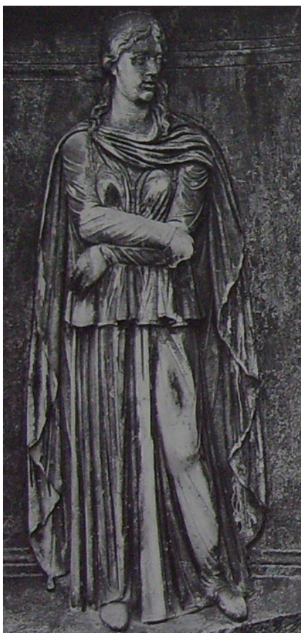
Obr. 58. Gallia, Hadrianeum