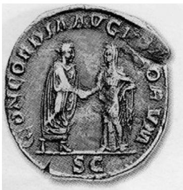
Obr. 67. Dextratrum iunctio - Alexandr Severus a Orbiana