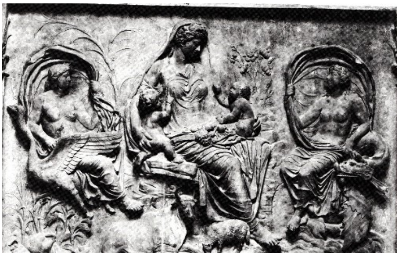
Obr. 5. Ara Pacis – Tellus s dětmi