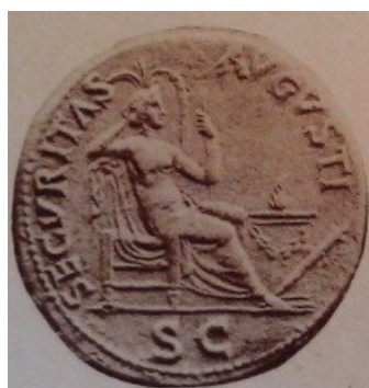
Obr. 33. Securitas