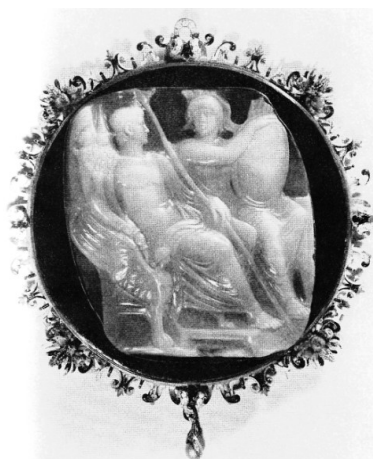
Obr. 13. Octavianus sedící na trůnu se sfingou vedle Romy