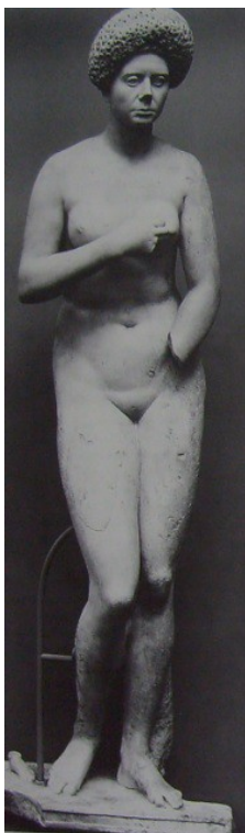
Obr. 40. Marcia Furnilla, villa u jezera Albano