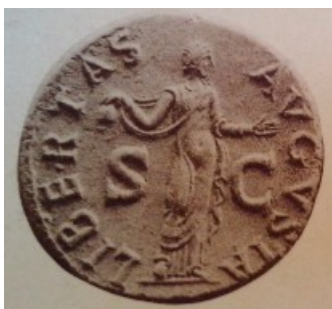
Obr. 26. Libertas na Claudiových mincích