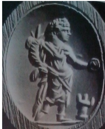
Obr. 66. Caracalla s rohem hojnosti