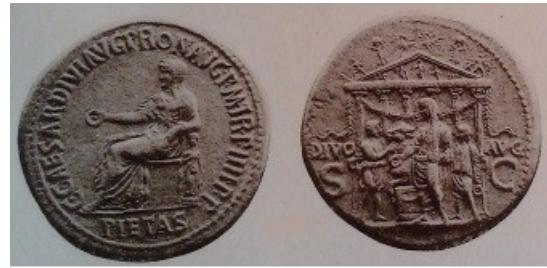
Obr. 19. Avers - Pietas, revers - Caligula před porážkou býka