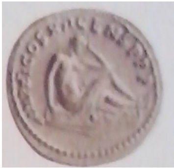
Obr. 44. Germania