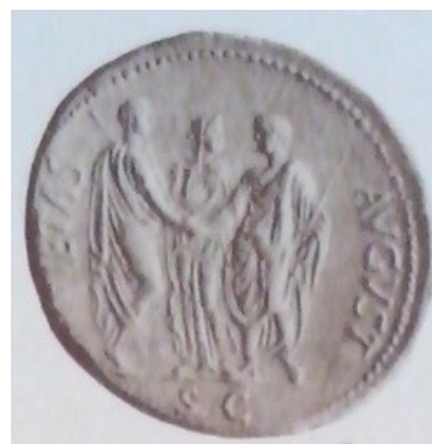
Obr. 39. Titus a Domitianus si podávají ruce