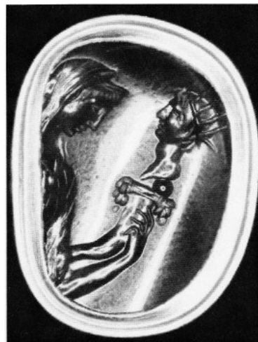
Obr. 4. Livia jako kněžka Augustova kultu s jeho bustou