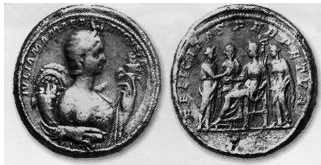
Obr. 68. Avers - Iulia Mamaea s atributy pěti bohyň, revers - Iulia jako Felicitas obklopená dalšími bohyněmi