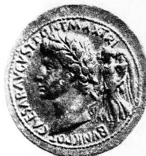
Obr. 7. Octavianus s Victorií