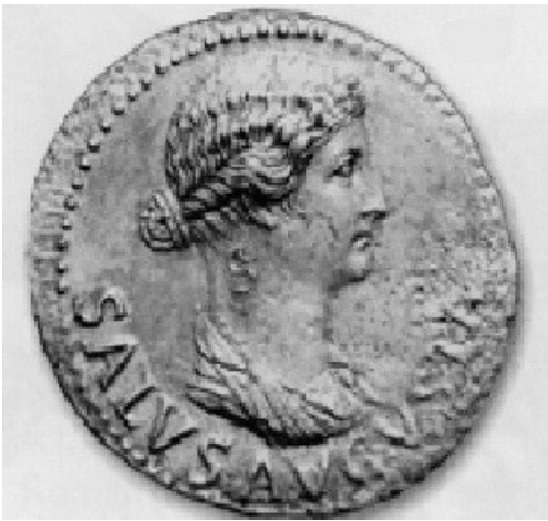
Obr. 14. Salus Augusta, tiberiovská ražba