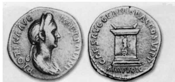
Obr. 47. Avers - Plotina, Revers - Oltář Pudicitie