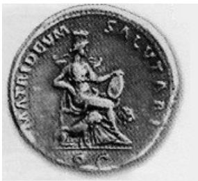
Obr. 55. Faustina mince s Kybelé