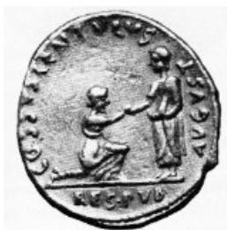
Obr. 11. Augustus a Res Publica