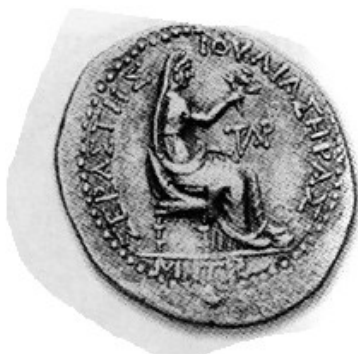
Obr. 3. Livia jako Héra/Iuno, mincovna v Tarsu