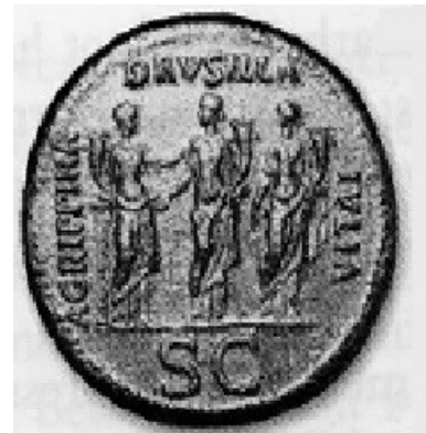
Obr. 17. Mince s Caligulovými sestrami