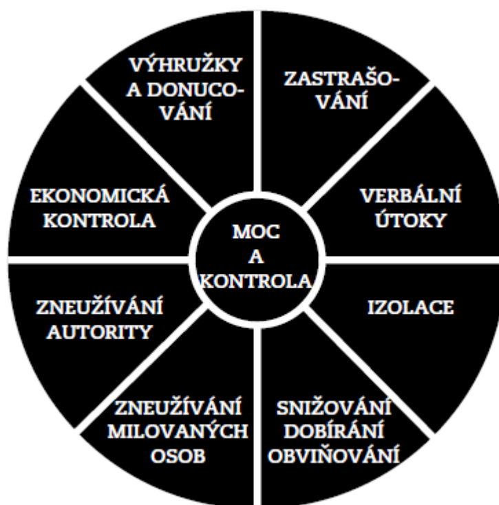
Obrázek 1 Kolo moci a kontroly (Linková, 2004)