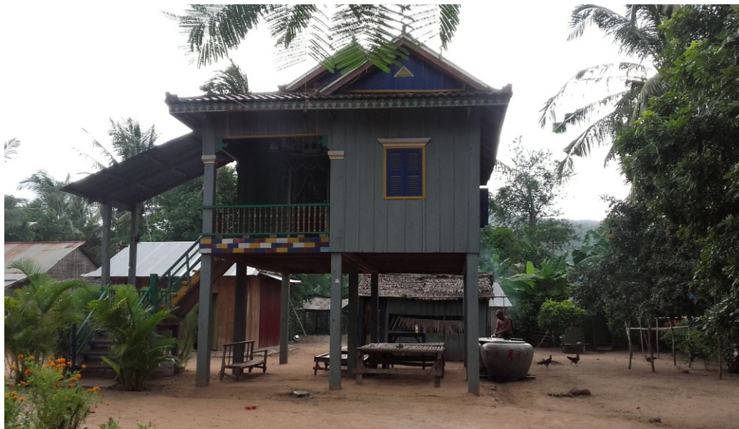
Obrázek 3: Typický homestay, Chambok, 17.9.2016