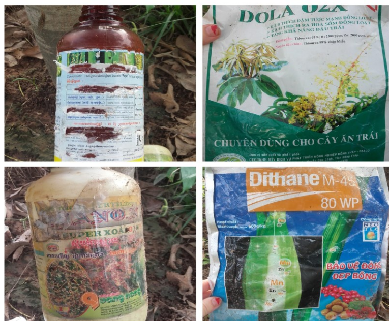
Obrázek 4: Chemikálie používané na mangových plantážích, Chambok, 3.10.2016