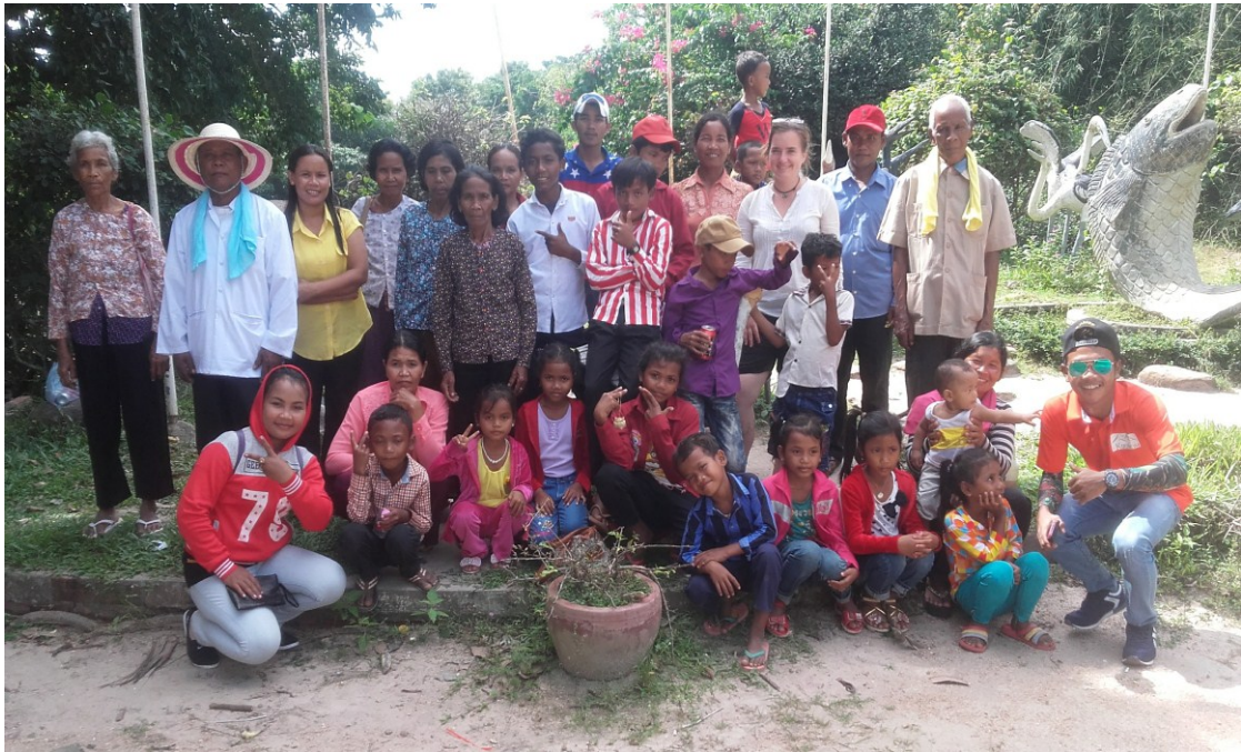
Obrázek 2: Rodinný výlet do zoo (Tamao mountain, Kambodža), 31.12.2016

měsíční výdělek (platila jsem 2$ za noc, 2$ za oběd a večeři a 1$ za snídani). Rodina měla dobré vztahy s celou vesnicí, takže jsem nepozorovala žádné nevýhody plynoucí z takto vřelého přijetí.