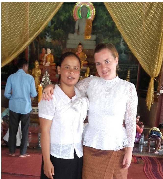
Obrázek 1: Festival Pchum Ben, Chambok, 25.9.2016