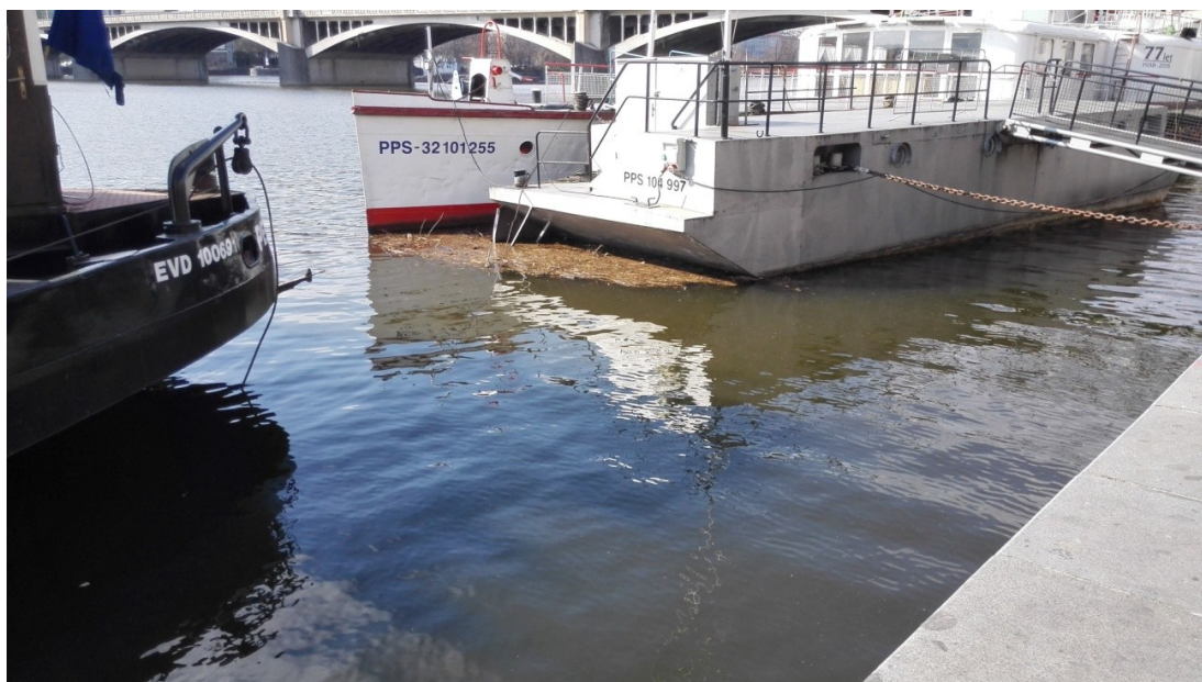
Obrázek 4 Nepořádek při břehu Vltavy.