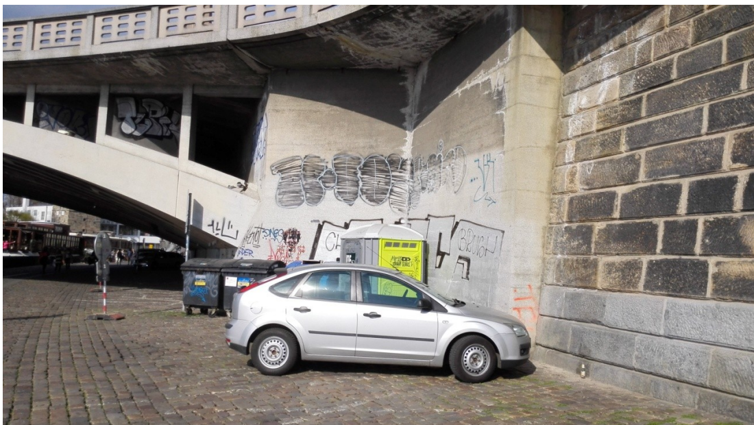
Obrázek 6 Grafity.