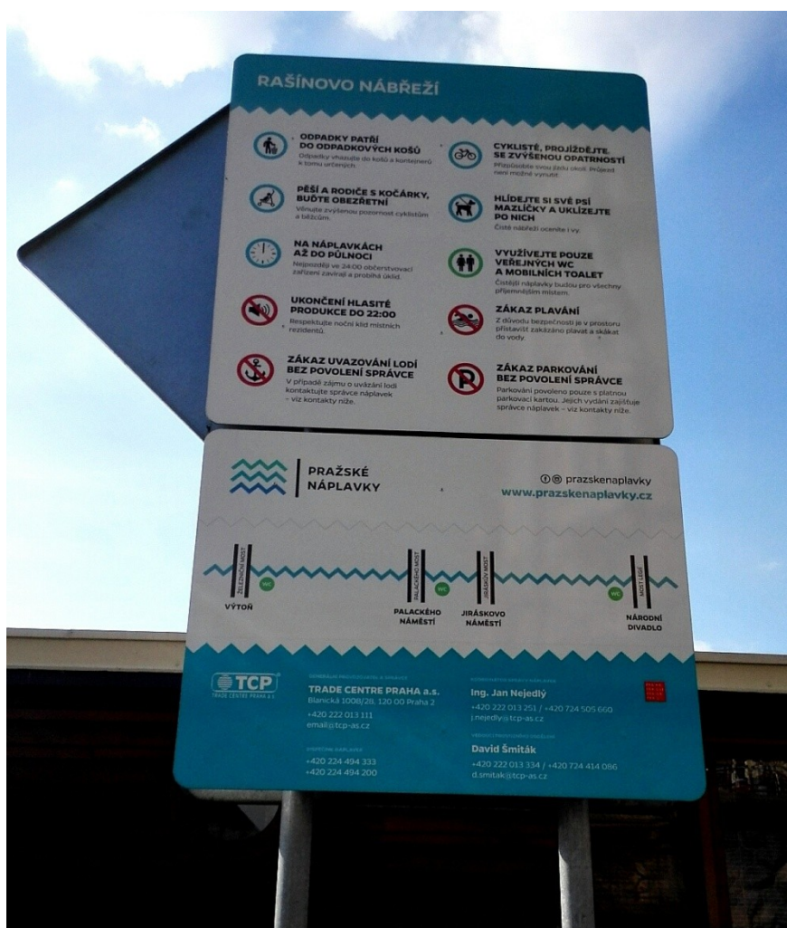
Obrázek 9 Návštěvní řád na náplavce.

Ačkoliv je náplavka součástí cyklotrasy A2, o čemž mluvil jeden z respondentů, není příliš vnímána jako dopravní tepna. Ano cyklisté náplavku stále ve velké míře využívají, také to byl jeden z původních účelů, ke kterým náplavka sloužila, ale v současnosti je vedena v patrnosti respondentů hlavně jako prostor, který je určený spíše pěším návštěvníkům. Tato skutečnost je také zavedena v návštěvním řádu. Viz obrázek.