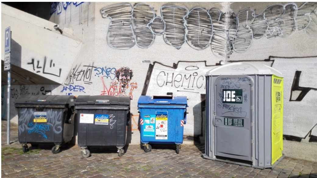
Obrázek 7 Kontejnery na náplavce.