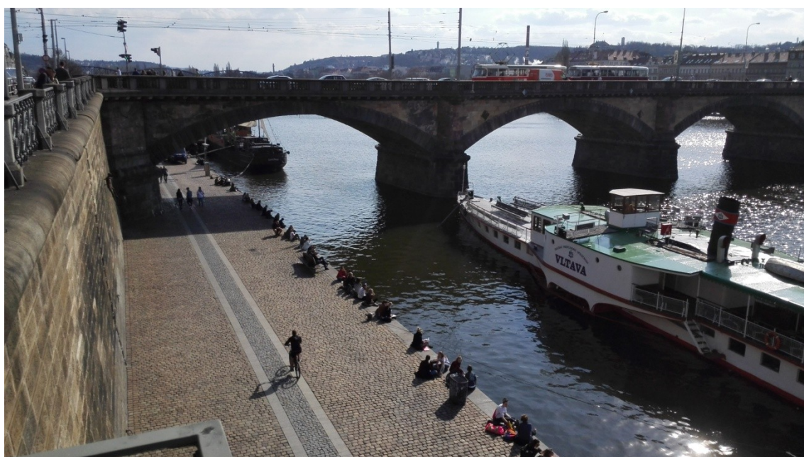
Obrázek 2 Náplavka přes den.

V rámci analýzy uživatelů a užívání městského veřejného prostoru hlavního města Prahy ve vedení Etnologického ústavu AV ČR proběhlo zúčastněné pozorování na náplavce roku 2014, nicméně toto pozorování nepřináší další poznatky, které by mohly rozšířit můj vlastní výzkum. [Beranská, Uherek 2014: 49-50]