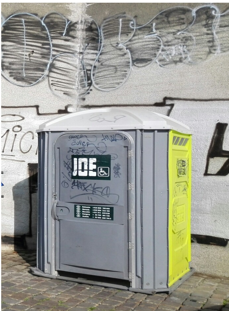
Obrázek 8 Nevhodné toalety.