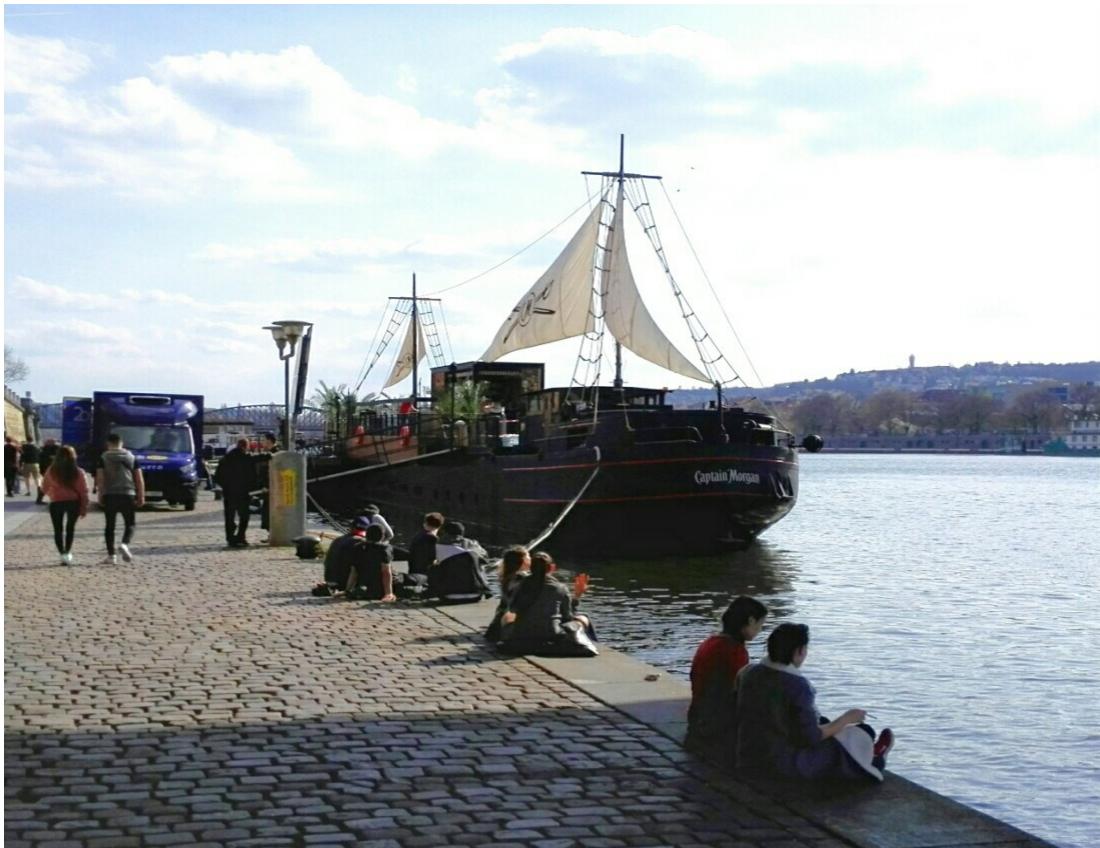
Obrázek 5 Reklama na náplavce.