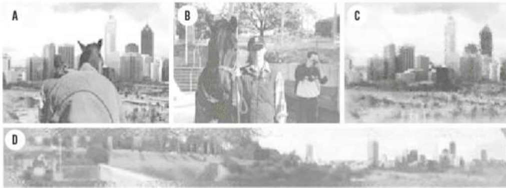
Obrázek 2. (Harmanová a kol., 1999)

Obrázky A a B ukazují dvojici pozorovatelů s výhledem zezadu (A) a zepředu (B). Obrázek C ukazuje zacílený vjem člověka vpřed. Obrázek D zachycuje to, jak se vědci pokusili znázornit panoramatický pohled koně, ve kterém je obraz přímo před ním lehce zkreslený, ale ukazuje nám panoramatický pohled v úhlu okolo 200°.