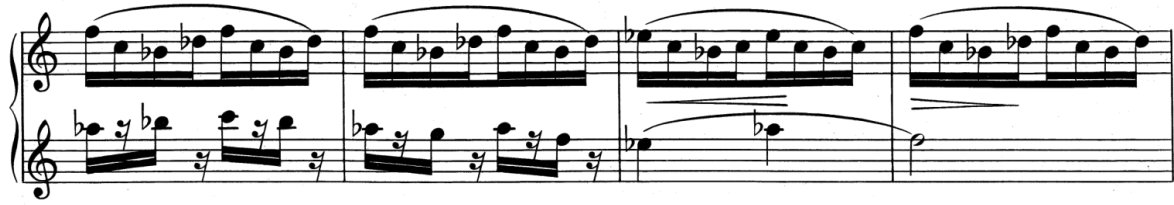
Příloha č.5: motiv rolniče s osudovým motivem 5