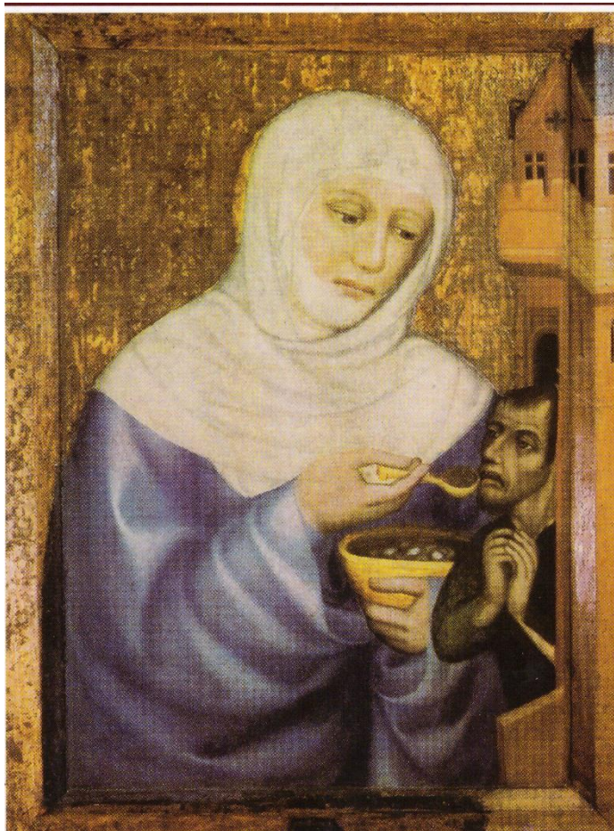
Mistr Theodorik, sv. Anežka Česká , 14. století