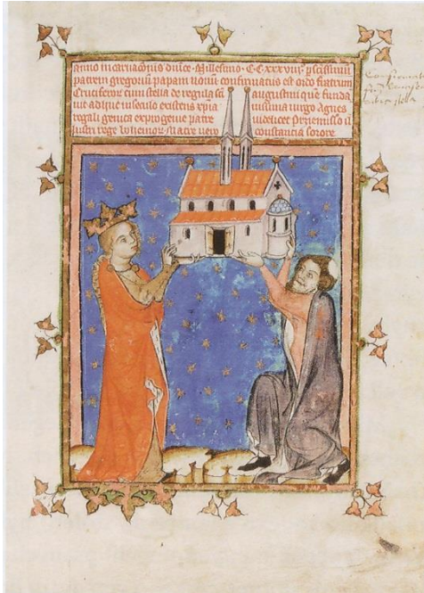
Breviř křiřovnického velmistra Lva, Aneřka Přemyslovna odevzdává řpitální kostel prvńimu křiřovnickému velmistru , 1356