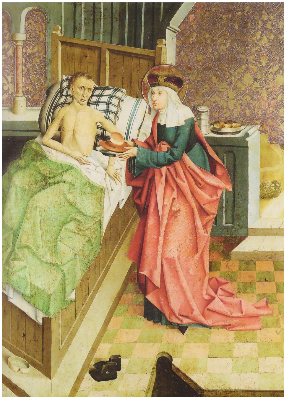
Oltář velmistra Mikuláše Puchnera, Sv. Anežka ošetřuje nemocného , 1482