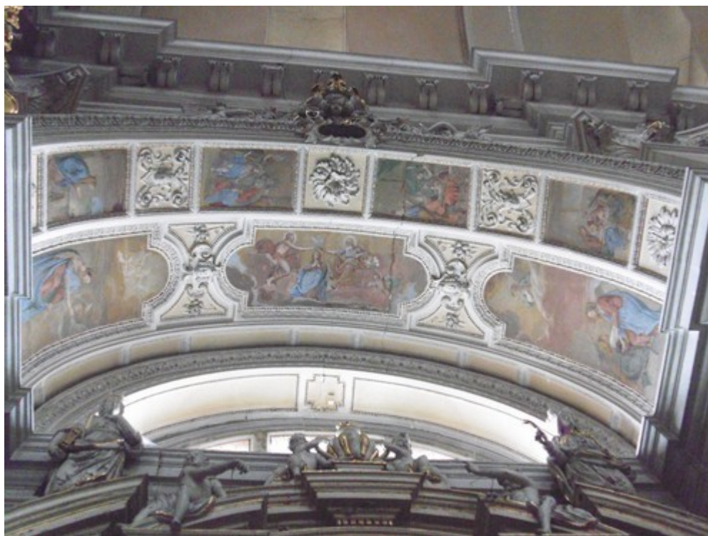
12. Stará Boleslav, kostel Nanebevzetí Panny Marie, 1617-1623, Berkovská kaple, nástropní freska.