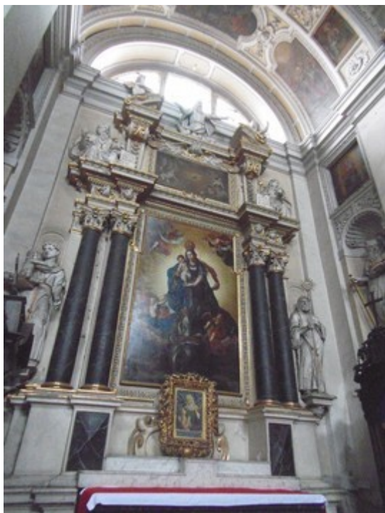
20. Stará Boleslav, kostel Nanebevzetí Panny Marie, 1617-1623, Morzinská kaple