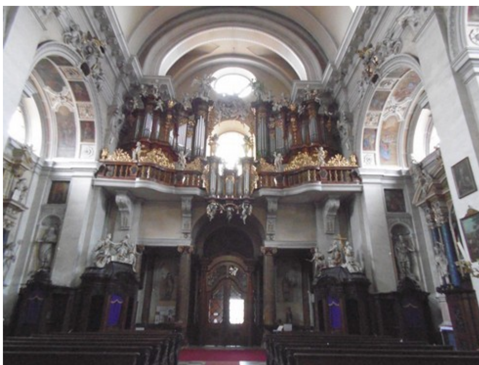
4. Stará Boleslav, kostel Nanebevzetí Panny Marie, 1617-1623, kruchta s varhany