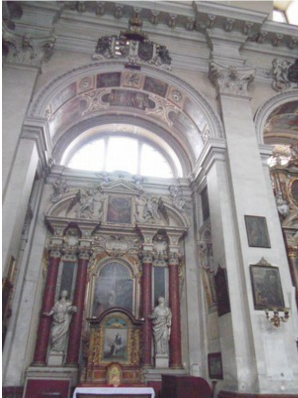
17. Stará Boleslav, kostel Nanebevzetí Panny Marie, 1617-1623, Slavatovská kaple