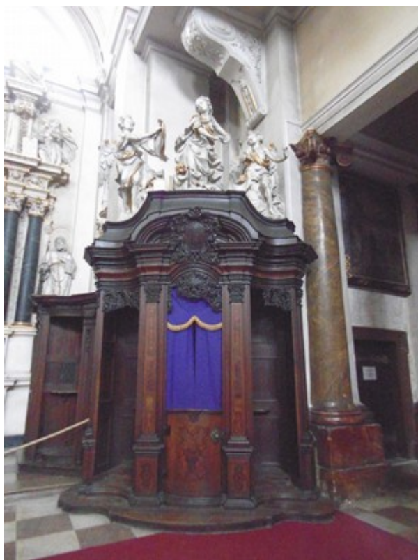
21. Stará Boleslav, kostel Nanebevzetí Panny Marie, 1617-1623, kazatelna, 1726