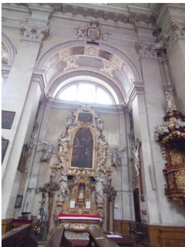
14. Stará Boleslav, kostel Nanebevzetí Panny Marie, 1617-1623, Černínská kaple