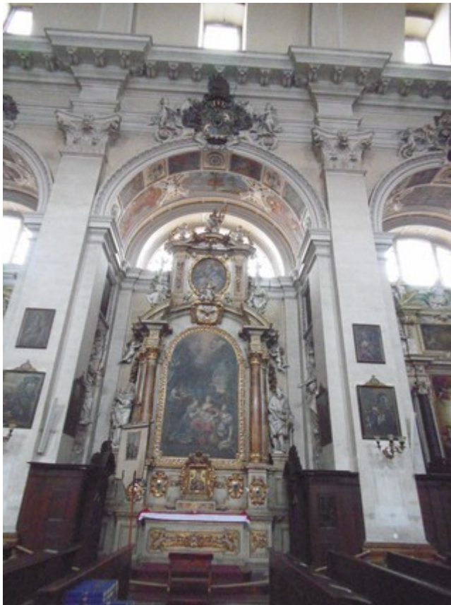
18. Stará Boleslav, kostel Nanebevzetí Panny Marie, 1617-1623, Valdštejnská kaple