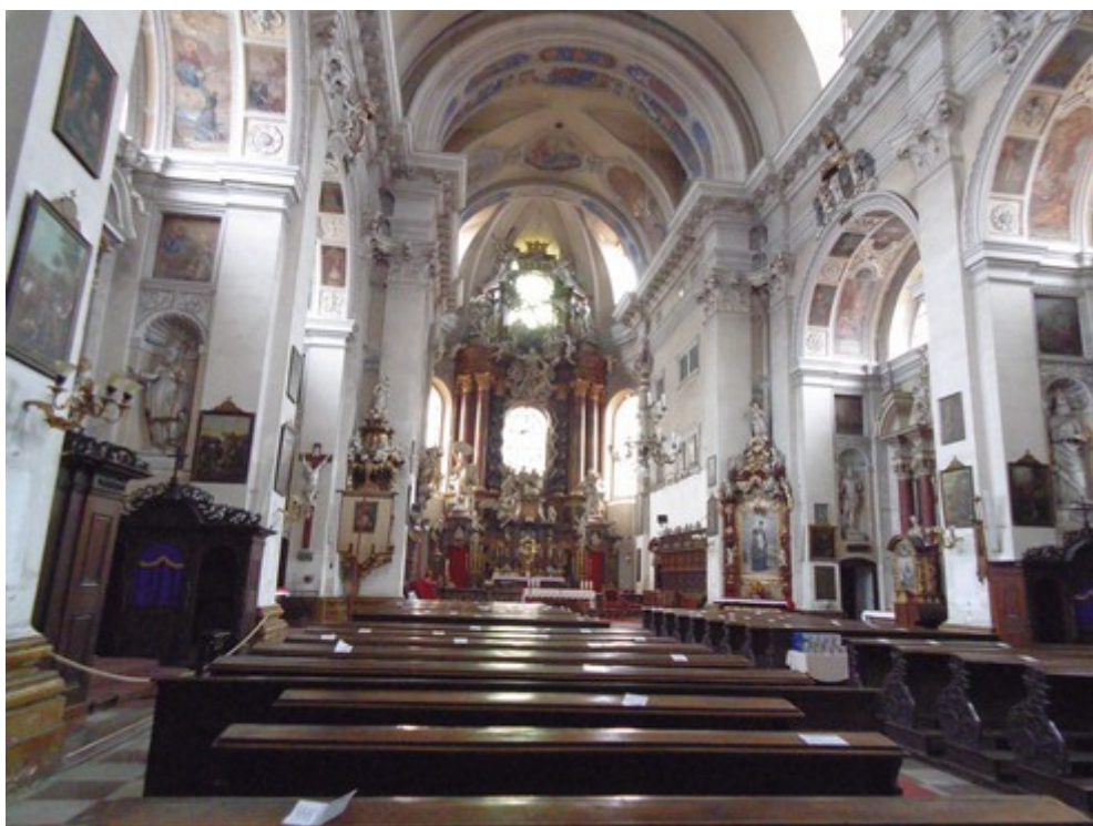
3. Stará Boleslav, kostel Nanebevzetí Panny Marie, 1617-1623, pohled do lodi