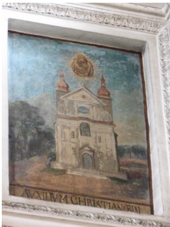
16. Stará Boleslav, kostel Nanebevzetí Panny Marie, 1617-1623, Černínská kaple, nástěnná freska