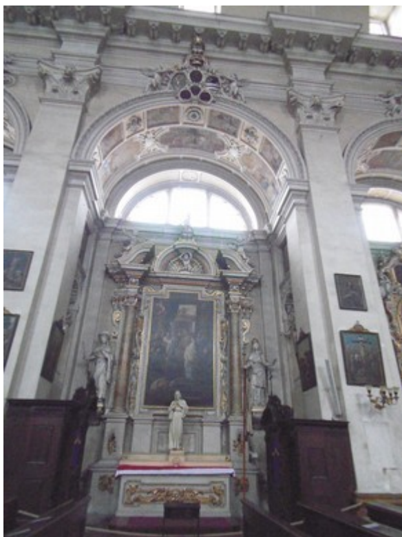
13. Stará Boleslav, kostel Nanebevzetí Panny Marie, 1617-1623, Lažanská kaple