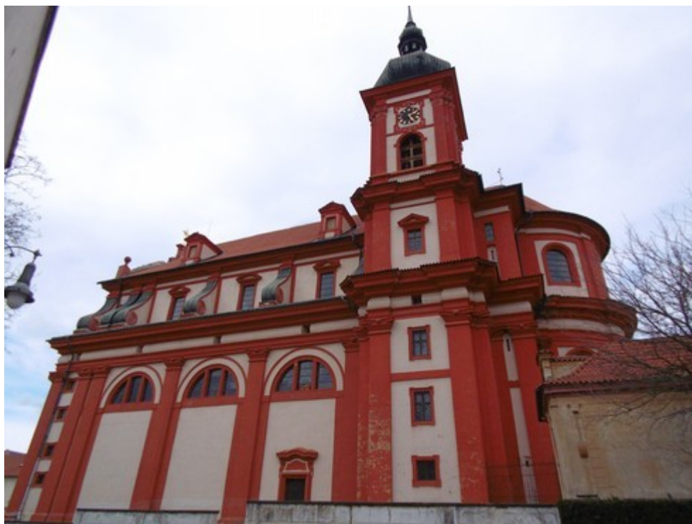
2. Stará Boleslav, kostel Nanebevzetí Panny Marie, 1617-1623, jižní fasáda