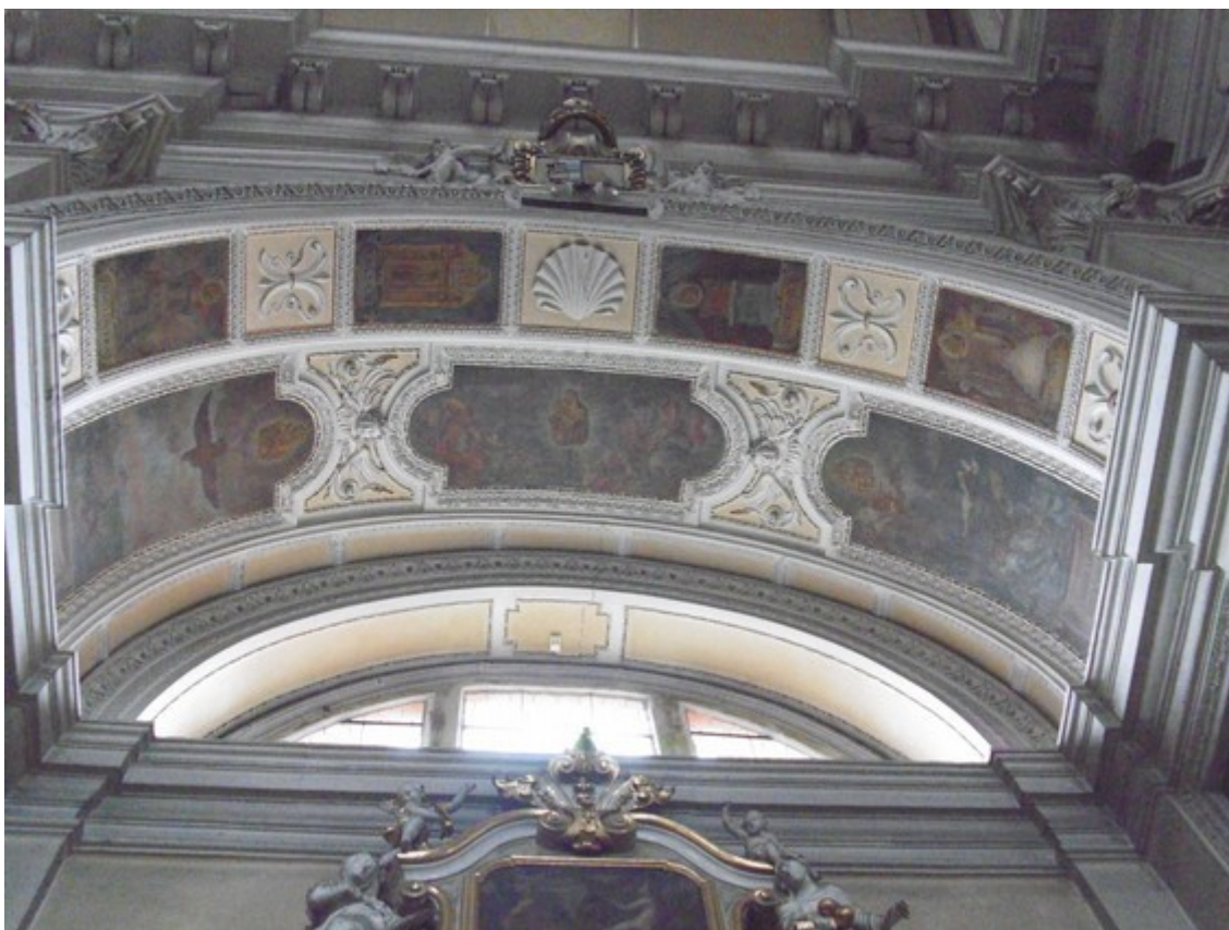
15. Stará Boleslav, kostel nanebevzetí Panny Marie, 1617-1623, Černínská kaple, nástropní freska