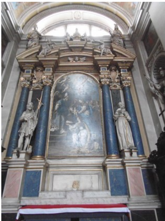
11. Stará Boleslav, kostel Nanebevzetí Panny Marie, 1617-1623, Berkovská kaple