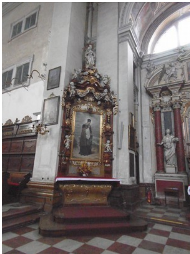
8. Stará Boleslav, kostel Nanebevzetí Panny Marie, oltář sv. Jana Nepomuckého, 1744