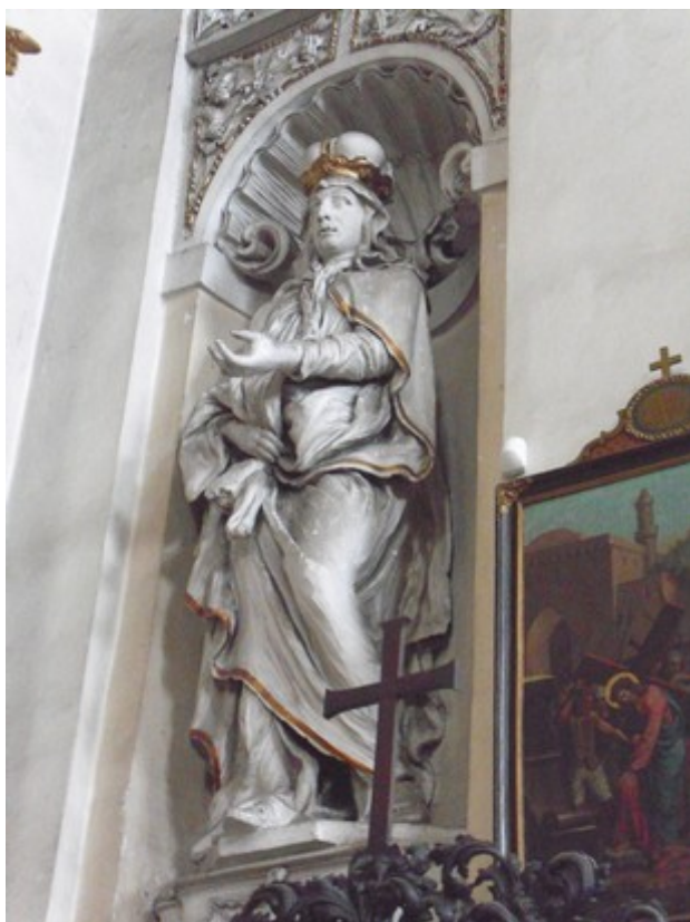
19. Stará Boleslav, kostel Nanebevzetí Panny Marie, 1617-1623, Valdštejnská kaple, socha sv. Ludmily