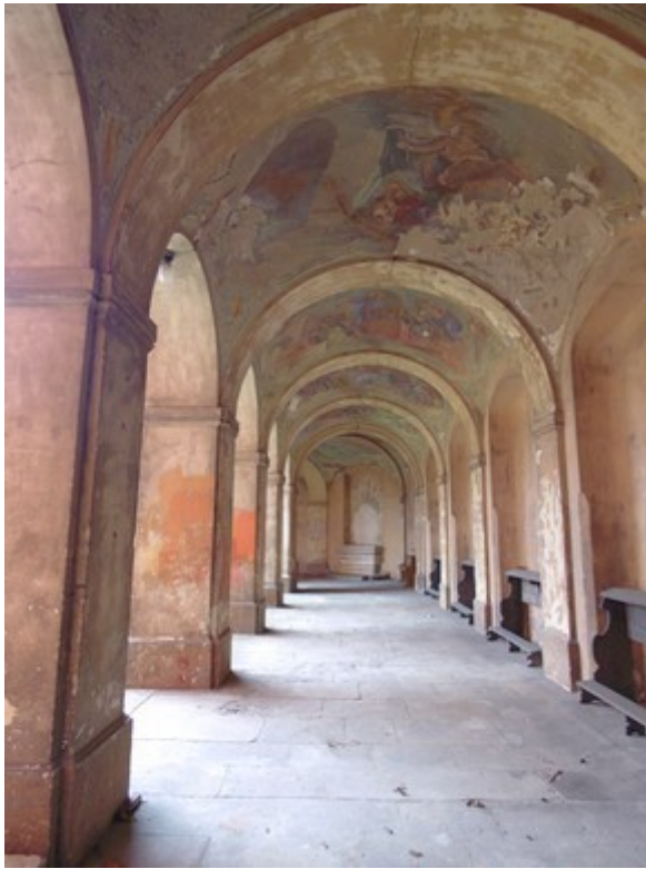
25. Stará Boleslav, ambity, 1728-1731