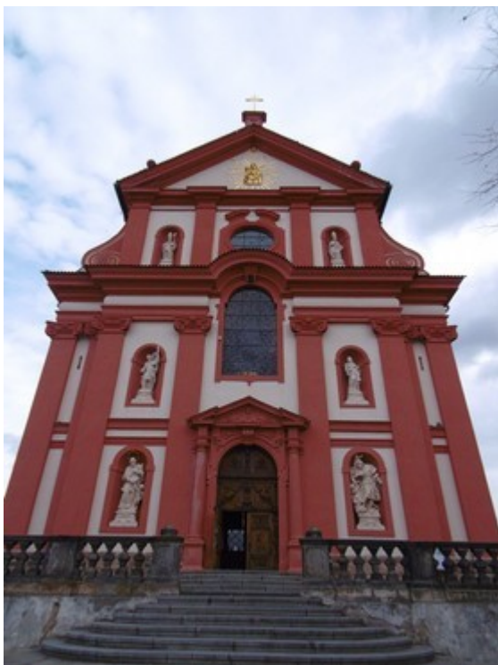
1. Stará Boleslav, kostel Nanebevzetí Panny Marie, 1617-1623, průčelí