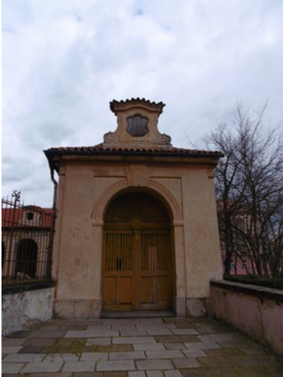
23. Stará Boleslav, ambity, 1728-1731