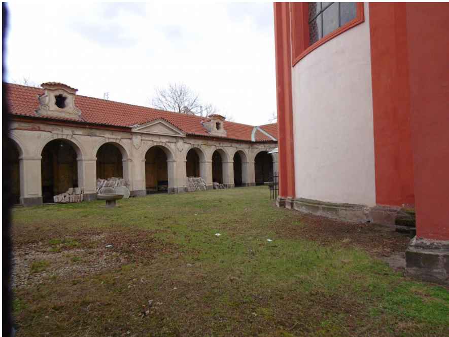
24. Stará Boleslav, ambity, 1728-1731