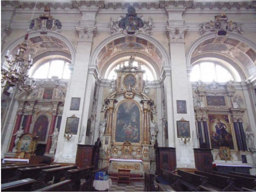
9. Stará Boleslav, kostel Nanebevzetí Panny Marie, 1617-1623, boční kaple jižní strana