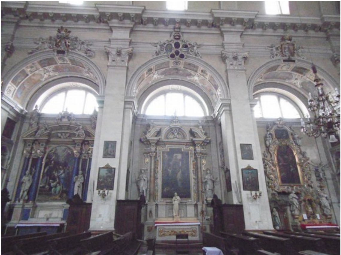
10. Stará Boleslav, kostel Nanebevzetí Panny Marie, 1617-1623, boční kaple severní strana.