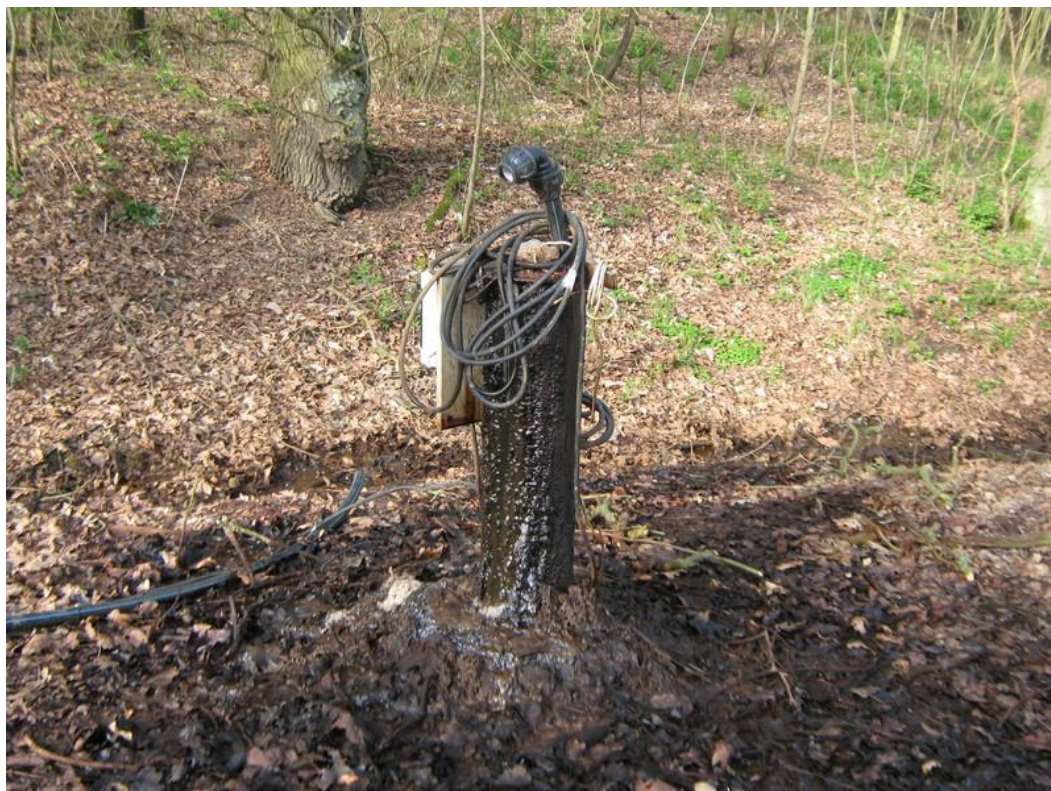
Zdroj: Město Zásmyky, 2017